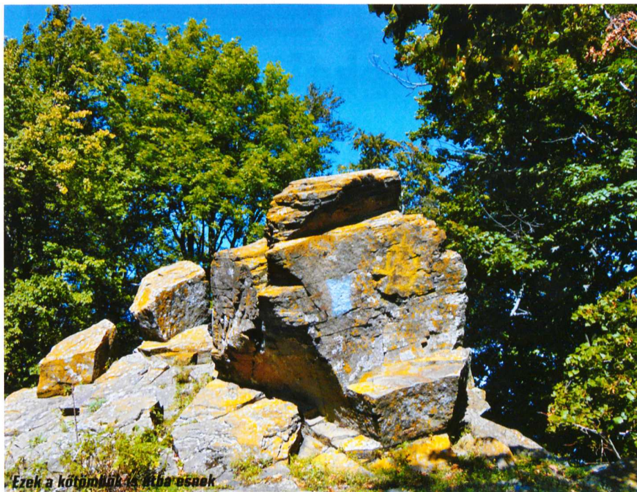
Ezek a kőtömbök is átka esnek