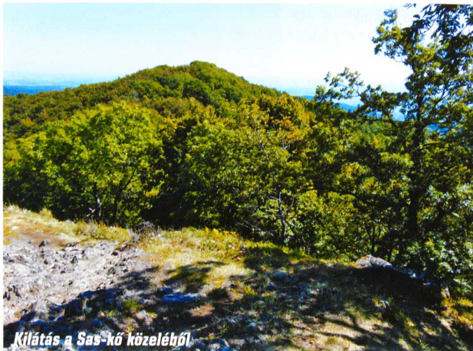
Kilátás a Sas-kő közeléből

Emelkedett érzés körültekinteni innen, a korlátra támaszkodva legeltetni szemünket a változatos, csodaszép tájon. Pár lépéssel odébb, a sziklafal kiszögellésén a teljes északi panoráma is feltárul. A Mátra lábai előtt heverő, az ormok előtt tisztelgő falvakra – Parádra, Parádfüldőre, Parádóhútra, Recskre – és a mögöttük hullámozó dombokra látunk, felismerhetjük a Karancs