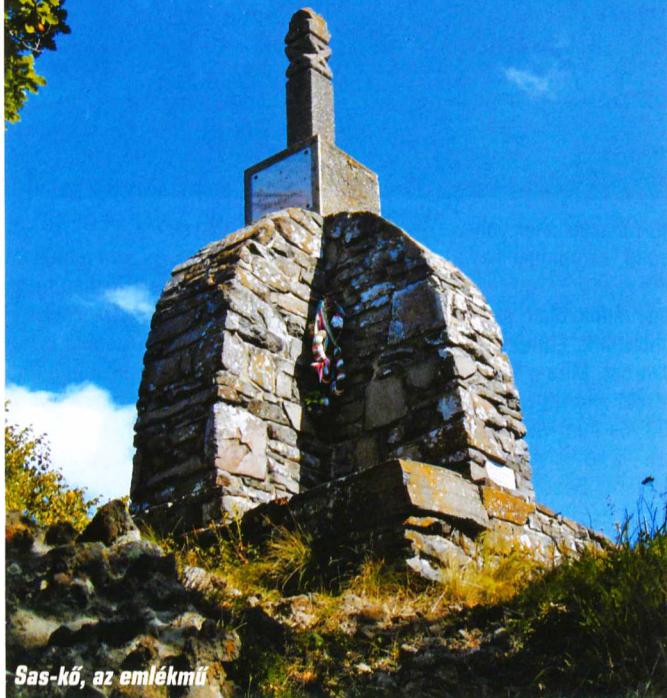
Sas-kő, az emlékmű

Igaz, a Sas-kő 898 méterével csak a Mátra hatodik legmagasabb csúcsa, a Kékes mellett a Hidas-bérc, a Galya- és a Pizskés-tető, a Lengyendi-Galya is megelőzi, de milyen elbűvölő már a neve is! A zord, sziklás, vadregényes sziklatorony pompás kilátóhely, és nyugalmat, lelki békességet kínál a vándornak. Évszázados bükkerdők árnyas sűrűjében járunk. Ezüstösen csillognak a törzsek, és talán a fák is irigyelnek minket, mikor a huncutul kanyargós ösvényeken járunk.