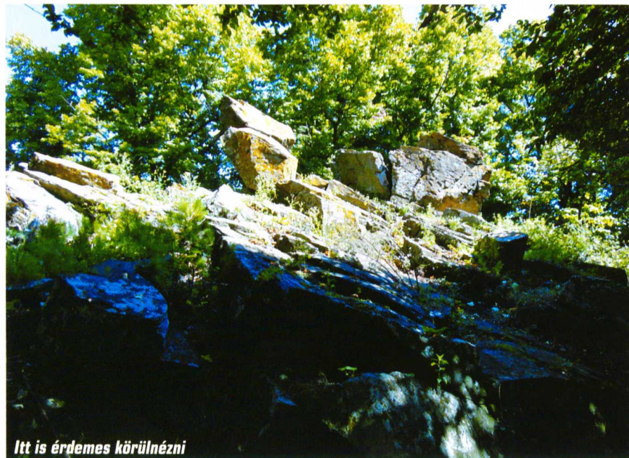
Itt is érdemes körülnézni

A Sas-kő szerepel a Rákóczi jelvénytű túra felkeresendő állomásai között. A Mátrában, különösen a Kékesen járva mindenképp érdemes felkeresni ezt a helyet, ha szeretnénk valami csodálatosat megtapasztalni!