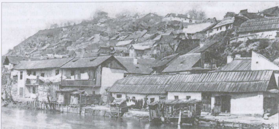
A Sánccoldal telepe mindenféle tervezés nélkül jött létre