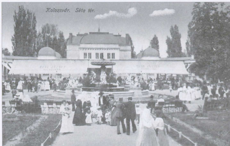
A kolozsvári Sétátér részlete, háttérben a Kaszinóval