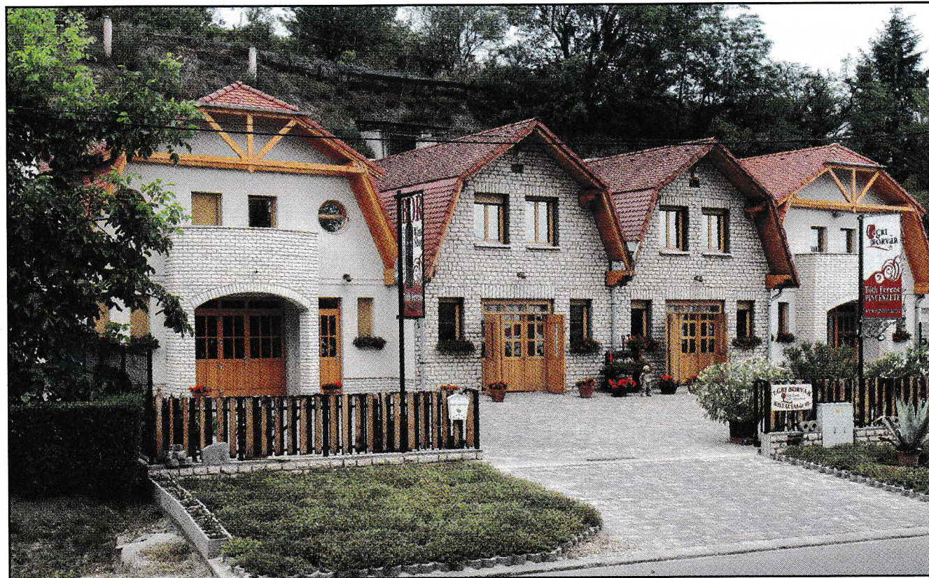
▲ A megújult Kistályai úti pincészet