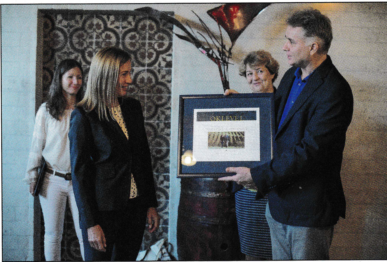
▲ Magyarország legszebb középirtoka, díjátadás