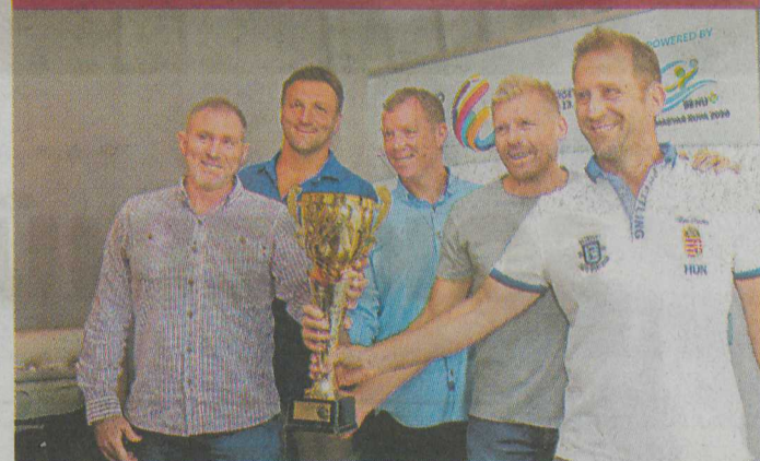
Nagy öregek, nagy mosolyok: értékes a Masters nyári kupája is

A második fordulóban azonos csoportban szereplő csapatok magukkal hozták az egymás elleni eredményüket.