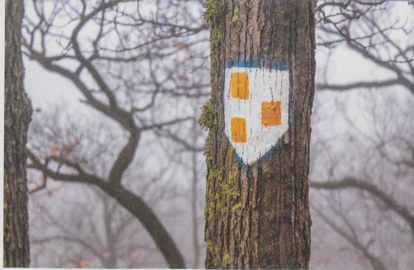
Ilyen jelölőpontokat kell keresnünk a túra során

havat. Pár lépéssel később a hegyoldalból felkapaszkodunk a Kecse-bérc kiugró sziklájára, ahonnan a szanatóriumra, a Somor-patak völgyére és a Kékesre nyílik szép kilátás. Itt is begyűjtünk egy igazolókódot, majd a sárgára visszatérve hotelek és parkolók mentén igyekszünk a következő panorámás igazolóhelyünkre. A sárga rom jelzésen teszünk kitérőt a Hanák Kolosról – a mátrai turizmus úttörőjéről és a hegység első útikalauzának megalkotójáról – elkeresztelt kilátóhoz, ahol az Alföldbe simuló mátrai táj megragadó látványa fogad bennünket. Az emlékoszloppal, padokkal és tűzrakóval ellátott pihenőhelytől meredekebb lejtésbe kezdünk, és egy kilométer után a Rákóczi-forráshoz érkezünk, amely a Mátra egyik legismertebb és sokak szerint legfinomabb vizű forrása. Ligetes, kőrises erdőrészben átkelve újabb panorámás helyre érünk fel, amely nem más, mint a fedett kilátóteraszos,