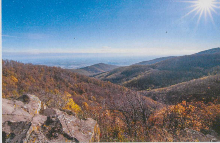
Ilyen a kilátás a 898 m magas Sas-kőről

A Parádi-medencére pazar kilátást nyújtó kilátóhelyet a kék háromszögön tett rövidke kitérővel érhetjük el: túránk felénél, egy újabb igazolópontnál járunk. Innen a Kis-Sas-kő északi oldalában felhágunk a gerincre, ahol a 898 m magas Sas-kő sziklaparkányáról tárul elénk kilátás. Kicsivel később az Erzsébet-sziklánál is körbetekinthetünk a magasból. Ezt a szakaszt a panorámák mellett a látványos sziklaalakzatok teszik felejthetlenné, mielőtt egy füves ösvényen lejtésbe kezdenénk a Sötét-lápa nyergébe, ahonnan megkezdjük a „kékesi rohamot”. Hazánk legmagasabb pontját, az 1014 m magas Kékest nem túl meredek emelkedővel hódítjuk meg. Az igazolójelet az ikonikus csúcskő mellett felállított Rákóczi-emlékoszlopon találjuk. A hegytető varázslatos mátrai panorámáját csupán a tévétorony körteraszáról élvezhetjük, de nem sokkal később, a sárga háromszög jelzésen tett kitérő során festői tisztásra érhetünk, ahol szédületes látványban lehet részünk