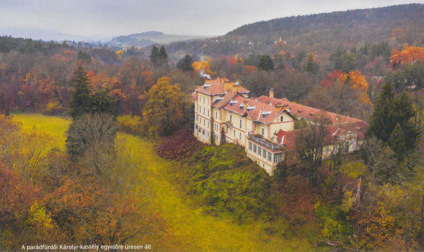
A parádfürdői Károlyi-kastély egyelőre üresen áll

felé, miközben változatos erdőkben haladva két igazolójelet is begyűjtünk a Sós-cseri- és a Hársas-tetőn.