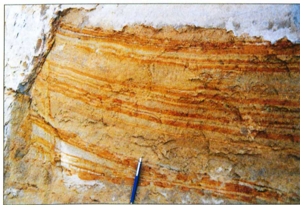
A vörös agyaglemezek jelzik a vakárák (sűrű lemezesség) és a szőkóárák (ritka lemezesség) váltakozását

Ebből a sorozatból a part menti öblökből kimosott, csökkent sótartalmú vízben élő puhatestűek héjtöredékei is előkerültek: tornyos ( Tympanotomus és Turritella ) és kövérkés ( Melanopsis ) csigák, vastaghéjú kagylók ( Ostrea ) maradványai. A csendesebb időszakokban kiülepedett