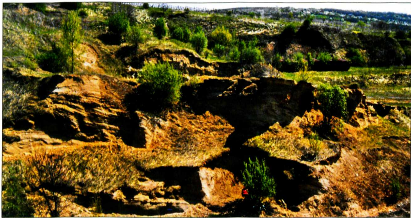
Az andornaktályai bánya a rekultiválás előtt

Az oligocén kor kezdetén járunk, amikor a kontinensek elhelyezkedése már hasonlított a maihoz, de a Kárpát-medencét még hiába keressük egy korabeli világtérképen. Helyén a Paratethys nevű tengerág húzódott, amely az Eurázsia és Afrika között korábban elterülő Tethys-óceánról, a két kontinens közeledése és az ehhez kapcsolódó hegységképződési folyamatok hatására fűződött le. Hasonló körülmények uralkodhattak benne, mint ma a Fekete-tengerben.