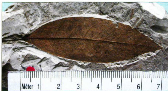
Babérféle ( Sassafras tenuilobatum ) levele

Az egykori alsó bányaudvar északkeleti sarkában található a legidősebb képződmények, amelyek a Wind-féle téglagyár