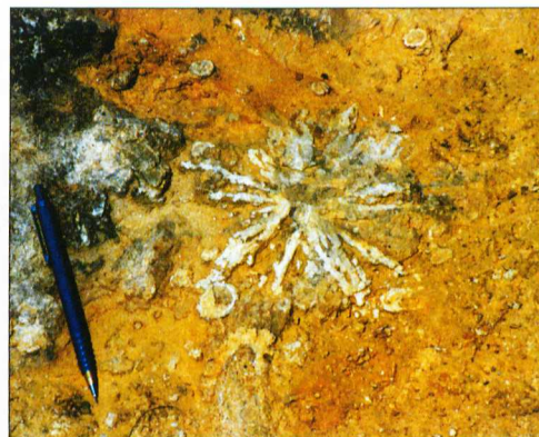
Csillag alakú nyomfosszília a homokkőpad felszínén

Az erre következő, a sáncsziiget hullámverés mosta fővenyartján, alig egy-két méteres vízmélységben lerakódott kavicsos homokban nyomfossziliák, vagy más néven életnyomok is megfigyelhetők. Az életnyomok az állatok mozgása, táplálékszerzése, vagy lakótevékenysége során kialakuló szerkezetek, melyek akkor is utalnak az egykori élőlények jelenlétére, ha azok nem őrződtek meg. (Az életnyomokról részletesen olvashatnak a szerző e lap hasábjain 2003 augusztusában megjelent cikkében.) Az itt megfigyelhető életnyomok 10–50 cm hosszú, függőleges, hajladozó, csőszzerű járatok, melyeknek falát kívülről homokból összeragasztott apró galacsinok borítják. Bár a járatkészítő élőlények általában nem ismertek – hiszen sokféle szervezet (kagylók, férgek, ízeltlábúak) készít hasonló járatrendszereket –, ebben az esetben mégis tudjuk, hogy a sekélyvízben élő,