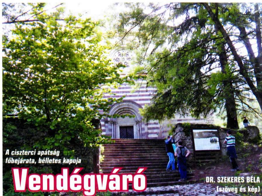
A ciszterci apátság főbejárata, helleltes kapuja