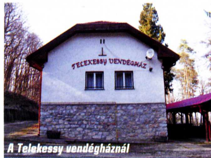
A Telekessy vendégháznál