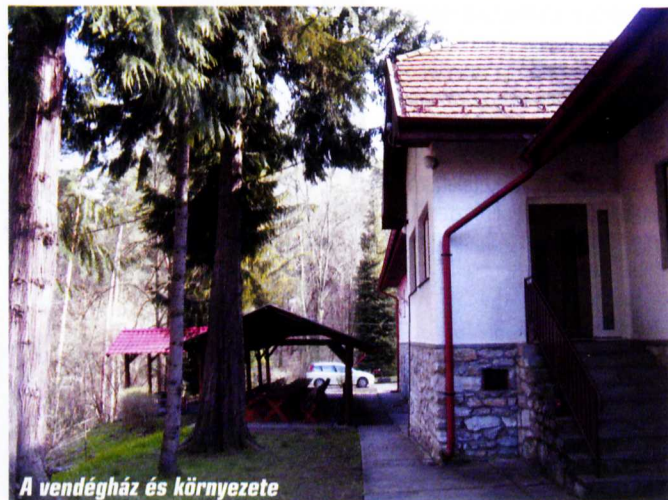
A vendégház és környezete

A leírás szerint „1891. július 6-án 140 taggal jött létre Egerben a Magyarországi Kárpát Egyesület Egri Bükk Osztálya, amely az I. világháborút követően több menedékházat is épített... így 1929-ben a Telekessy István menedékházat. A ma is vendégházként működő épület előtt található a Bükk neves turistájának, turisztikai