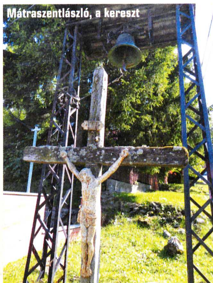
Mátrászentlászló, a kereszt

indultam volna a vízeséshez, kényelmesen körbenéztem a kórház sétányán és lent, a Köves-patak menti parkban is, de az egykori Idősek otthonának épületénél is jártam. Romantikus séta volt ez a múlt nyomdokain. Az „elvarázsol” szobrok, az épületek, a dús növényzet hatása!