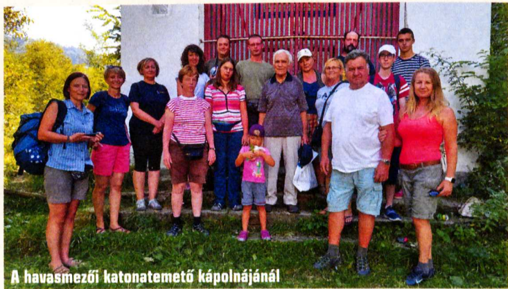
A havasmezői katonatemető kápolnájánál