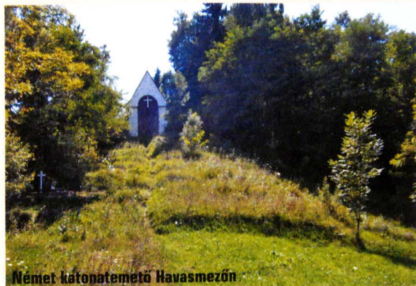
Német katonatemető Havasmezőn