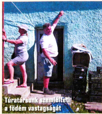
Túratársunk szemlélteti a földem vastagságát