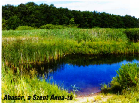
Abasár, a Szent Anna-tó

domságban található Mogyoródi Hegyközség is. A Mátrai Borvidéken tevékenykedő borászok hegyközségekbe tömörültek, ezek a következők: Abasári, Markazi, Ecsédi, Gyöngyösi, Gyöngyöspatai, Gyöngyöstarjáni, Szücsi, Mogyoródi, Nagyrédei, Gyöngyössolymosi és Visontai Hegyközség.