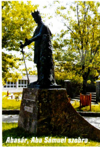
Abasár, Aba Sámuel szobra

korának egyetlen ránk maradt és feltárható, bemutatható királyi udvarháza.