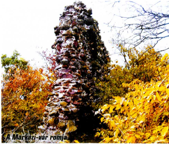
A Markazi-vár romja