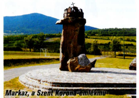
Markaz, a Szent Korona-emlékmű

Az országos hírnévnek örvendő jogász-turista-borász 1923-ban távozott az élők sorából, de emlékét napjainkban sokfelé őrzik. Abasár is hálás szívvel gondol egykori szőlész-borászára, ezt tükrözi a Hanák Kolos Könyvtár és Községi Ház elnevezése és a Községházán lévő emléktábla. A természetjárók sem feledkeztek meg a neves turistáról, a gyöngyösi Hanák Kolos Turistaegyesület immár 30 éve jelkesedik mátrai teljesítménytúrák rendezésében.