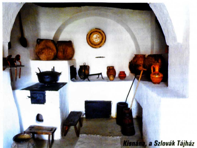
Kisnána, a Szlovák Tájház

A vele szemben lévő Kézművesházban valamikor egy módos gazda lakott, családja