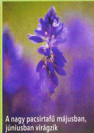
A nagy pacsirtafű májusban, júniusban virágzik