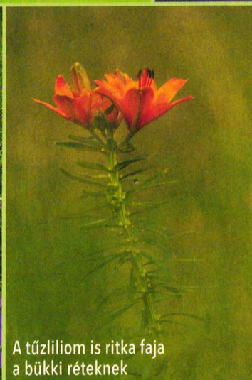
A tűzliliom is ritka faj a bükki réteknek