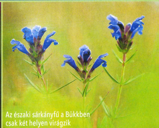
Az északi sárkányfű a Bükkben csak két helyen virágzik