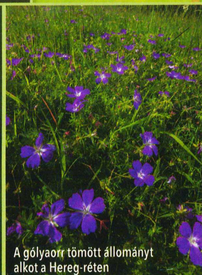
A gólyaorr tömött állományt alkot a Hereg-réten