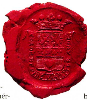
A De la Motte-ok címere pecséten

1745-ben De la Motte Ferenc Károly követte német-római császárrá koroná-