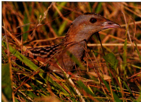
A haris karsú testének köszönhetően a sűrű növényzetben is könnyedén mozog

lák helyét átvették a monokultúras, nagytáblás termesztési módok, ahol az intenzív termesztés igényeinek megfelelően rendszeresen használnak műtrágyákat és növényvédő szereket. Jelentős mértékben csökkentek, sok helyen teljesen eltűntek a fészkelésre alkalmas élőhelyek, a mezőgazdasági kemizáció pedig nemcsak leszűkítette, hanem sok helyen időszakosan meg is semmisítette a faj táplálékbázisát alkotó rovarvilágot. A harisállományok Nyugat- és Közép-Európában kritikus, sőt tragikus helyzetbe kerültek. Nem volt kivétel ez alól a Kárpát-medence sem, mert a mezőgazdaság termelési szerkezete néhány évtizedes késéssel itt is megváltozott, és a termelés intenzitása itt is követte a nyugati példát. Nem csodálkozhatunk azon, hogy a 13/2001. (V. 9.) KöM rendelet a harist is a fokozottan védett fajok közé sorolta, és természetvédelmi értékét 500 ezer forintban állapította meg.