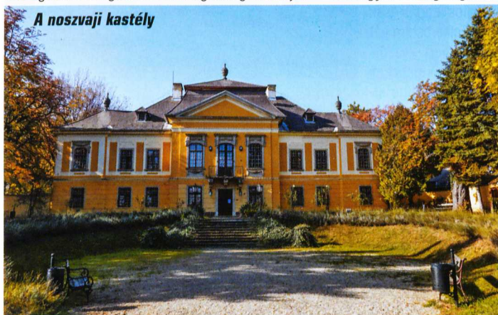
A noszvaji kastély

Az emeleti előtér mennyezetén Kracker János Lukács neves barokk festőművész alkotását látjuk, ami a hajnal istennőjét, Auróra diadalmenetét ábrázolja. A szekéren Apollót, a napistent látjuk, amint díszes hintóján végiglovagol az égen. Az oldalfalakat római istenek gúnyképei díszítik, ezek korabeli francia karikatúrák alapján készültek a gróf kérésére. Az előtérből a középső ajtón a díszterembe, a kastély legnagyobb fogadótermébe léphetünk be. Itt zajlottak a fogadások, bálók, koncertek, előadások. A mennyezeti freskón a bor istene, Bacchus jelenik meg. A mennyezetre festett égbolt a magasabb belmagasság illúzióját