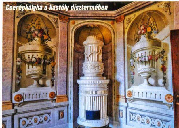
Cserépkályha a kastély dísztermében

kaptárkőcsoportja. A kiváló állapotú, jól kialakított és hasznos információkat nyújtó tanösvény jó példa a természeti értékek kulturált bemutatására. Ha a kaptárkövek rejtélyét nem is oldottuk meg, igen hasznos információkkal felvértezve, számos természeti és épített örökség emlékével gazdagodva fejezzük be utunkat.