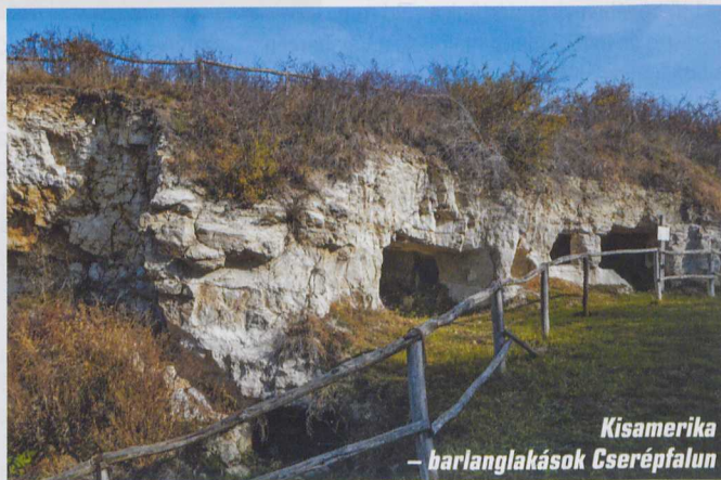
Kisamerika – barlanglakások Cserépfalun

romok maradtak, köveit nagyrészt elhurcolták a falubeli építkezésekhez.