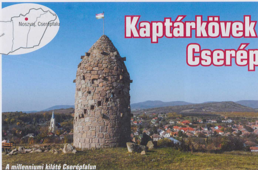
A millenniumi kilátó Cserépfalun

A Bükkalja vidékén keletről nyugat felé haladva a kácsi Kecse-kő és a Siroki-vár közötti területen számos helyen fordulnak elő olyan vulkáni sziklaalakzatok, kúp alakú kőtornyok, amiknek az oldalába az ősidők emberei különböző méretű, mélységű fülkéket faragtak. Összesen 41 lelőhelyen, 82 sziklaalakzatban 479 fülkét számoltak össze a kutatók. A fülkés tornyok, cukorsüveg alakú kúpok mintegy 20 millió évvel ezelőtt, a földtörténeti miocén korban a hasadékvulkánokból feltörő vagy kirobbanó riolitos anyagú kőzetekből, zömmel tufákból jöttek létre. A Bükkalján több száz méter vastagságú ez a vulkáni tufaréteg.