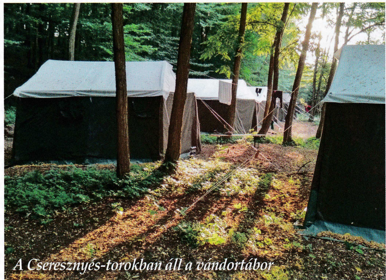
A Cseresznyés-torokban áll a vándortábor