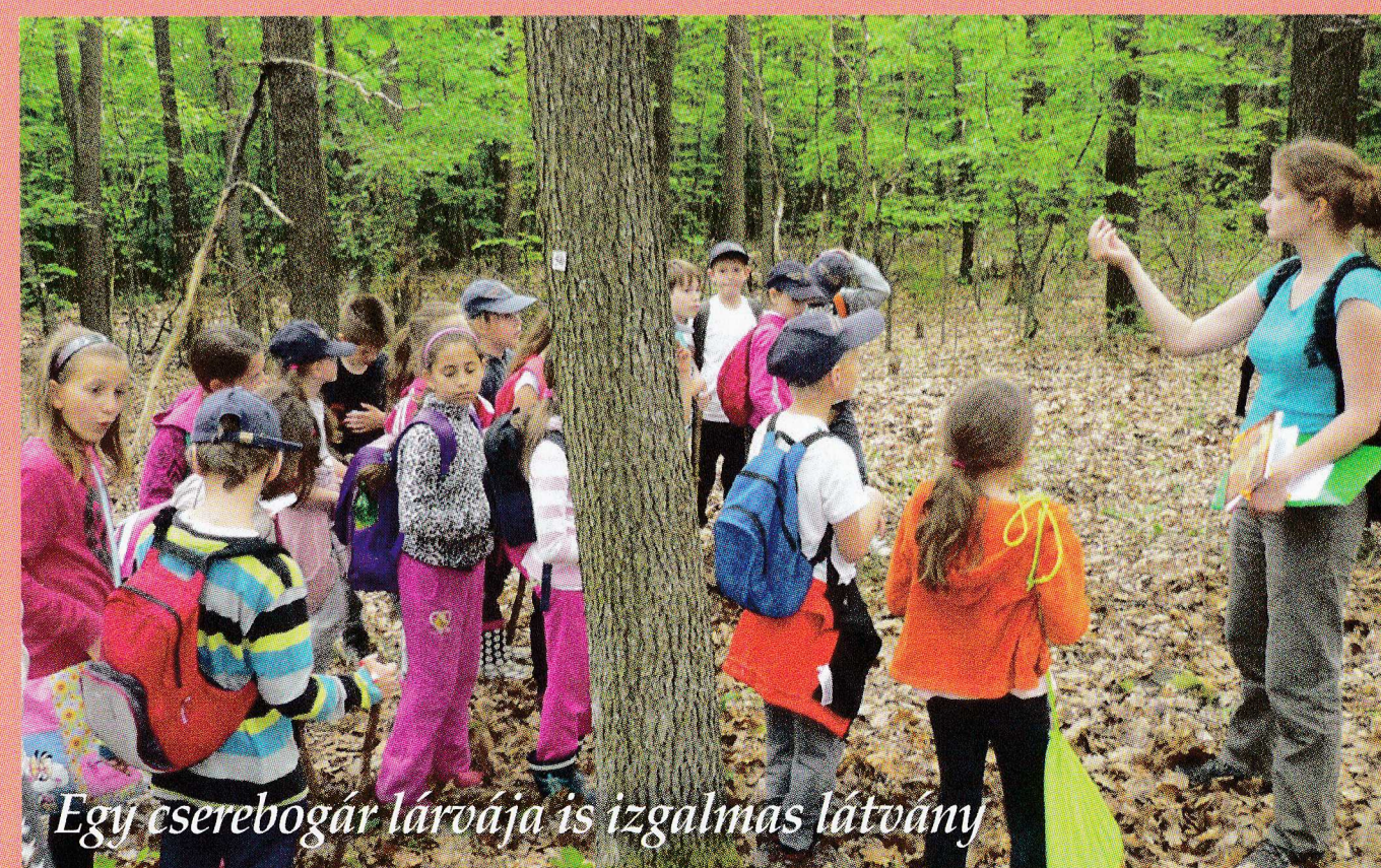
Egy cserebogár lárvája is izgalmas látvány