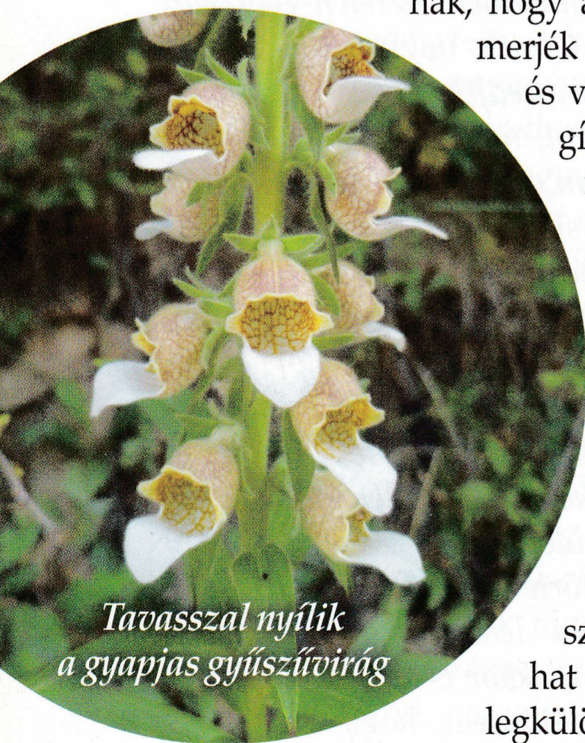
Tavasszal nyílik a gyapjas gyűszűvirág

Már hagyomány, hogy május végén a Tari Önkormányzat az EGERERDŐ Zrt. támogatásával megrendezi a Tuzson napot Fenyvespusztán. Azon a napon az érdeklődők erdész szak-