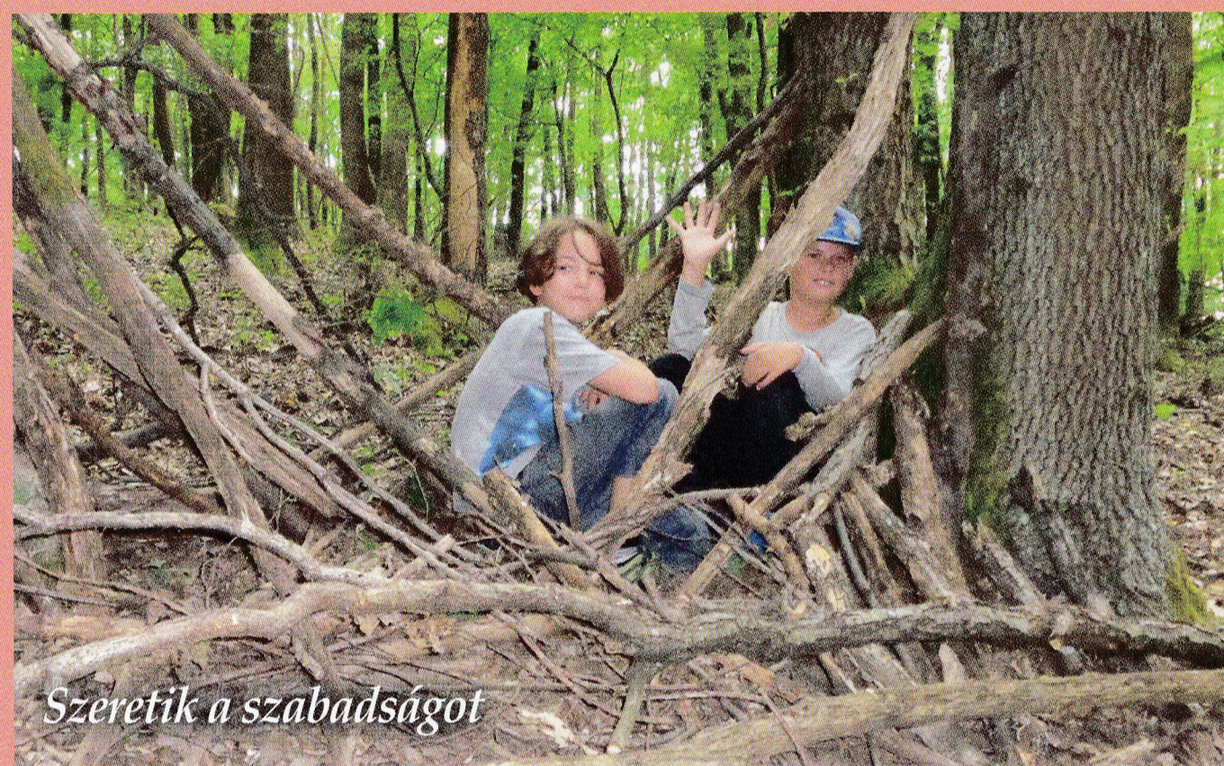
Szeretik a szabadságot