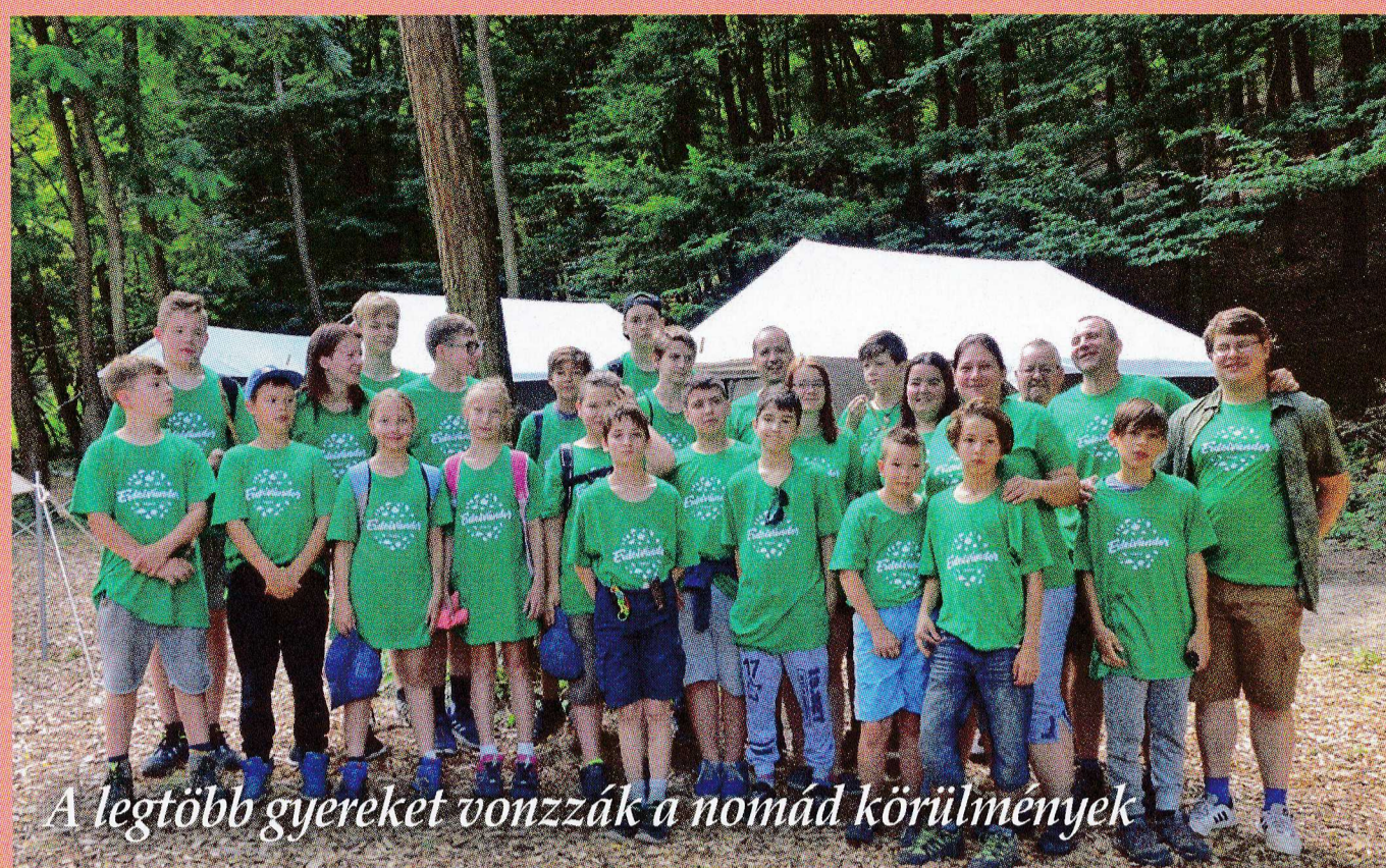
A legtöbb gyereket vonzzák a nomád körülmények