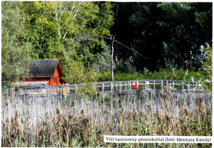
Vízi tanósvény gémeskúttal

A tapasztalatok szerint a Tisza-tóhoz 100-150 kilométer távolságról érkeznek a vendégek. A fő küldőterület Észak-Magyar-