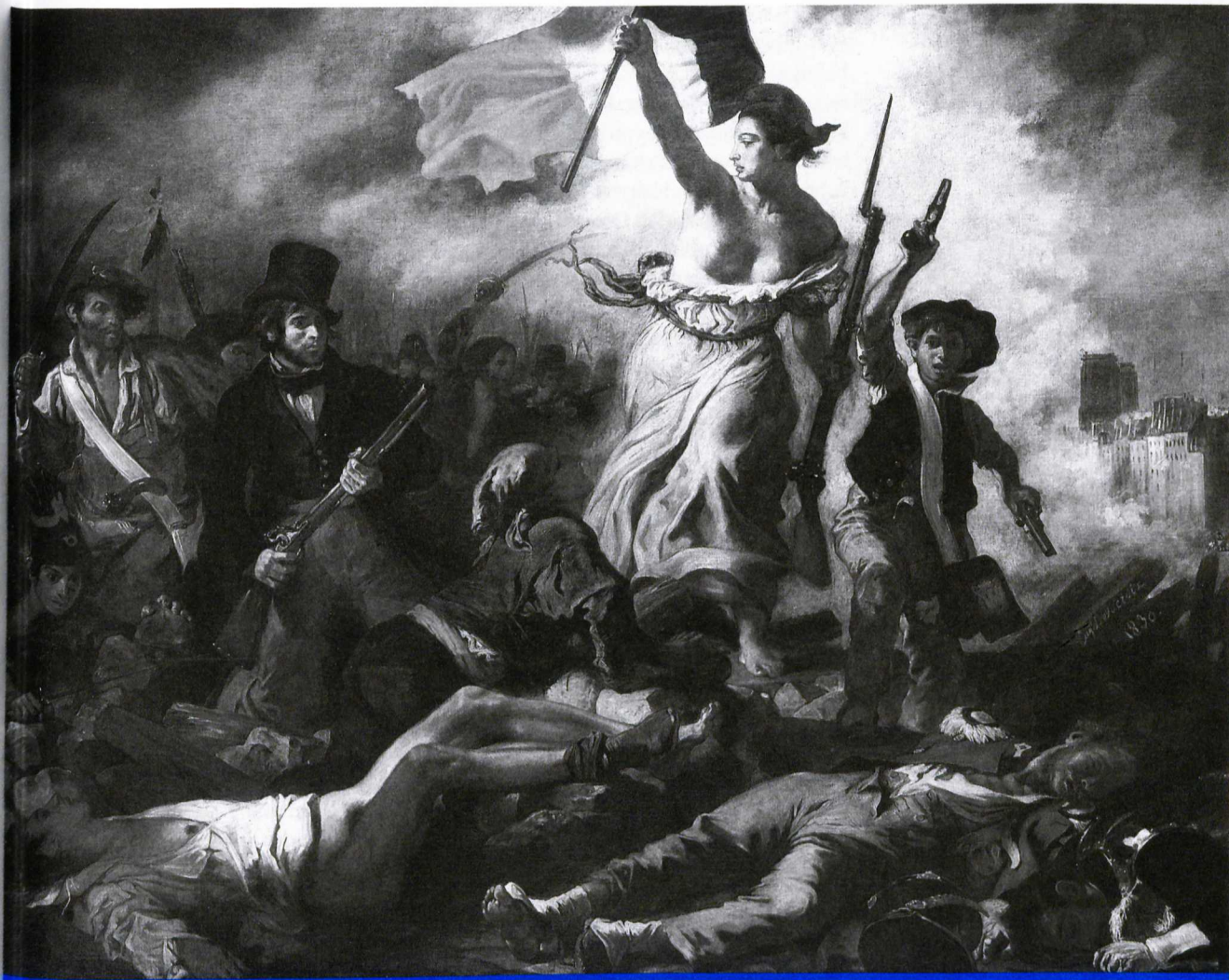
„Szabadság! Itten hordozák véres zászlóidat” – Eugène Delacroix: A szabadság vezetői a népet (1830)