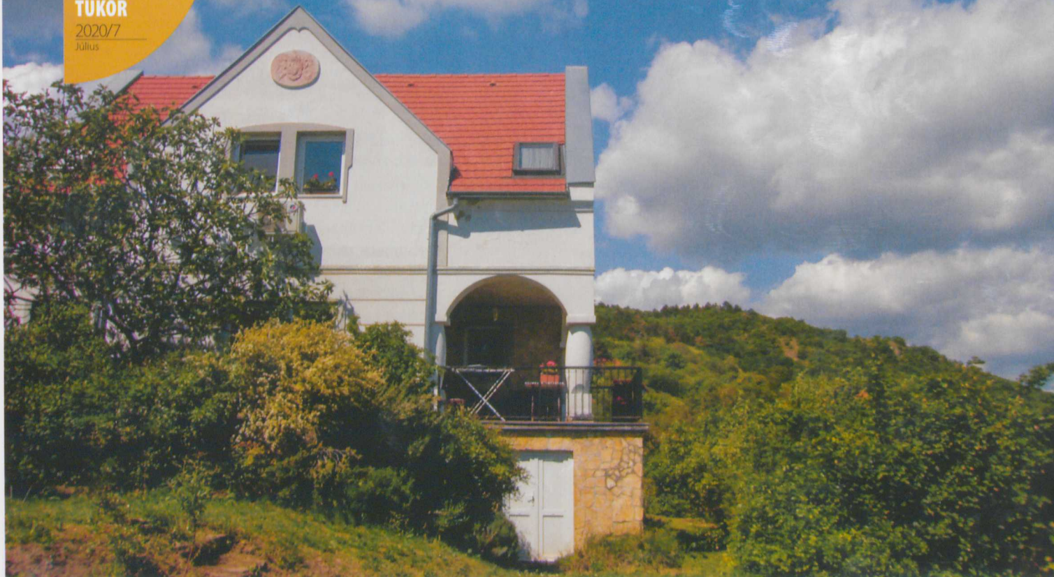
A második otthon Balatonyörökön, a Bece-hegyen

csapatjátékos vagyok, amolyan társulati színész. Vágyom egy olyan társaságra, amelynek tagjaival azonos stílusban játszhatunk, együtt gondolkozva hozhatunk létre valami jót. Na ez hiányzik. Még a Madách Színház tagja voltam, amikor máshová is ki-kikacsingattam. Vendégeskedtem a Karinthyban, Tatabányán, magánszínházakban. Szabadúszóként rengeteget játszottam Szolnokon, Kecskeméten, Győrben. Rövid időre az Új Színházba szerződtem, ahol egy nagyon érdekes, új koncepció körvonalazódott. Aztán úgy alakult, hogy mégsem akarok ott tovább játszani. Most megint e kényszerű szabadúszás van.