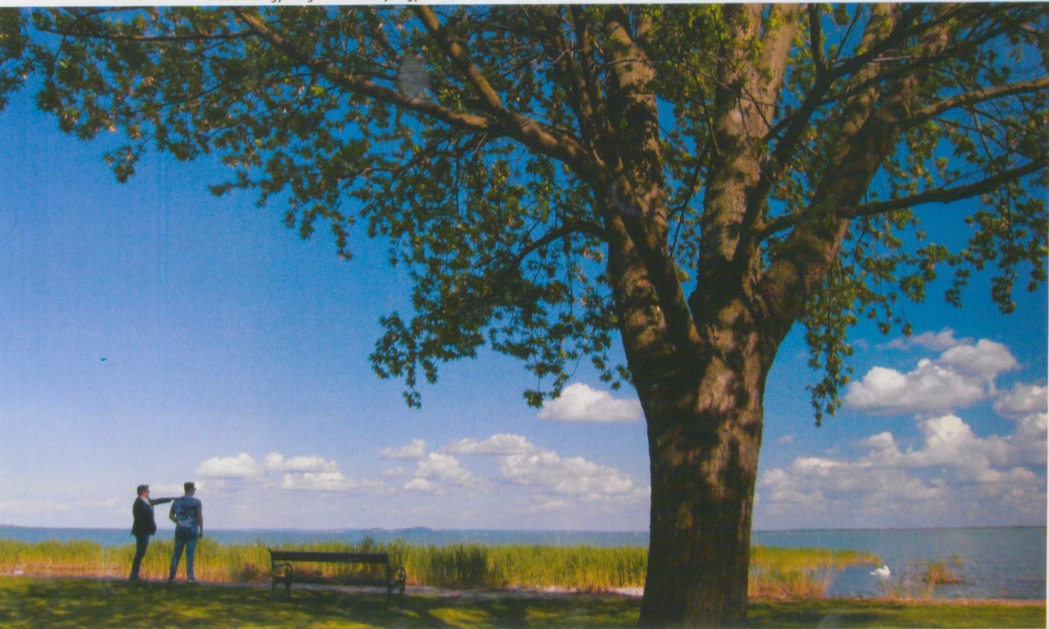
A Balaton egyik legszebb strandja a győröki

Én a szépségtől mindig több lettem. Például néhány percig egyszerűen csak nézem ezt a csodálatos balatoni tájat, és több leszek tőle. Vagy elolvasok egy jó könyvet, megnézek egy érdekes filmet, jól elbeszélgetek valakivel, és ezekből töltekezem. Ezekből az akkumulációs pillanatokból táplálkozom, építkezem folyamatosan szakmailag és emberileg is. Szóval nagyon fontos a szépség az életemben. ■