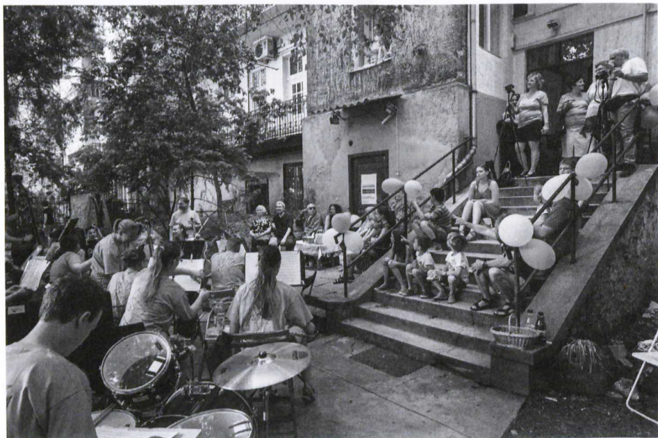
Udvari koncert a Batthyány utca 31-ben

va az, hogy Minden ház érdekes! , de ebből a sok érdekességből válogatást kellett összeállítani. Meg akartuk mutatni, hogy teljesen más kézzelfogható módon nézni egy ilyen történetet és ezt a nagyon személyes részét a Budapest100-nak: hogy itt a lakók is részt vesznek, közben pedig nagyon izgalmas építészeti- és szociológiatörténeti érdekességeket lehet találni a házakban. Ha előttünk van egy hatalmas nagy adatbázis, azt persze lehet böngészni, de egy könyv szerintem teljesen más minőséget ad mindennek.