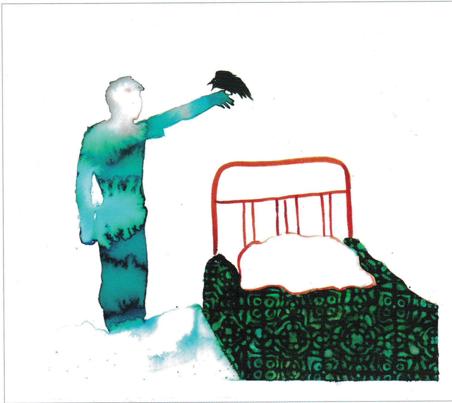
BÁNKÚTI GERGŐ: Akvarellek cím nélkül , 2018, 23×27 cm BÁNKÚTI GERGŐ: Akvarellek cím nélkül , 2018, 27×23 cm

Valljuk be, nincs ebben semmi rendkívüli: nap mint nap erre törekszünk magunk is, többé-kevésbé elégedetlenül mindazzal, ami eddig történt körülöttünk, hogy ne foglaljuk el az előkelő idegen pozícióját környezetünkkel,