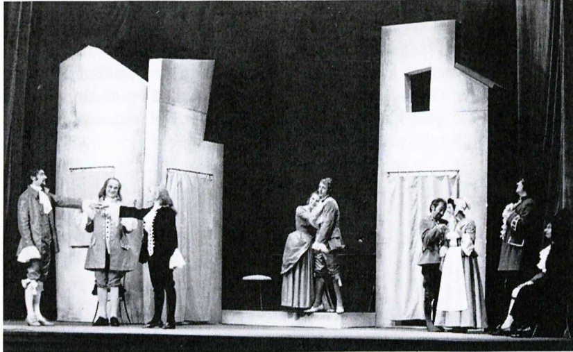
Carlo Goldoni: A két úr szolgálja (Thália Színház, Kassa 1969)

Tekintettel arra, hogy ez a 2018-as, 2019-es két év nemcsak a te személyes évfordulód, nemcsak a te színészi, rendezői pályádnak a kerek évfordulója, hanem 2019-ben még egy fontos