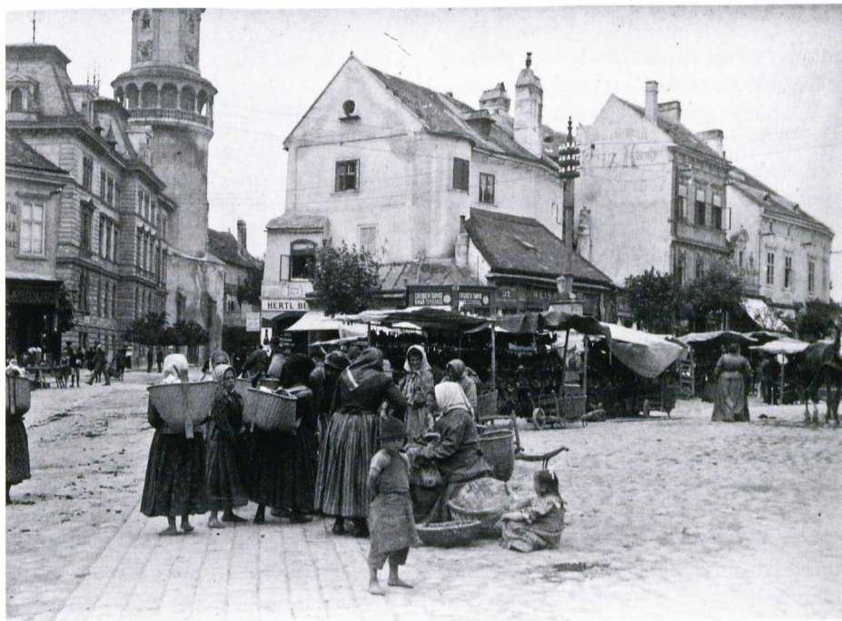
Portékákat kínáló parasztasszonyok a háború második évében a soproni piacon A TÚLOLDALON: Az első világháború kitérését éljenző tömeg 1914 augusztusában, Budapesten. Nem tartott sokáig, amíg az öröm ürömbe fordult

a vallási és kulturális autonómia több elemét is biztosította. Politikai nemzetként, azaz egyenjogú államalkotó partnerként való elismerésüket, s ennek keretében az általuk követelt területi és politikai autonómia biztosítását azonban következetesen elutasította. A két álláspont a későbbiekben sem került közelebb egymáshoz, sőt inkább még távolodott. A területi autonómiát követelő nemzetiségi vezetők a századfordulót követően részben a nem-