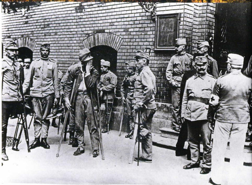
Hadirokkant katonák várakoznak egy kórház előtt A TÚLOLDALON: Az utolsó magyar király, IV. Károly eskütétele 1916. december 30-án a budai Szentháromság-szobornál, balra Csernoch János esztergomi érsek áll

Az életviszonyok változása maga után vonta a világgal, politikával és különösen a háborúval kapcsolatos hangulatok, érzelmek és vélemények módosulását. A hadüzenet és a háború hírére 1914 nyarán a lakosság jelentős része hazafias lelkesedéssel fogadta. Az 1914–1915-ös népi levelekben, versekben és egyéb feljegyzésekben általában még a győzelembe vetett hit, a király és a kormány iránti bizalom, önfeláldozás készsége s helyenként elvakult sovinizmus tükröződött. A nemzeti egységből még az egyébként internacionalista és háborúellenes szociáldemokraták sem hiányoztak. A II. Internacionálé néhány más pártjához hasonlóan – eltekintve a kisebbséget képező pacifista balszárnytól – a Magyarországi Szociáldemokrata Párt is