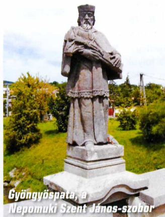
Gyöngyöspata, a Nepomuki Szent János-szobor

ugyanis jelzett turistaúton mintegy 15 kilométert kellene gyalogolni, hogy a következő felkeresendő helyünkre, Gyöngyöstarjánba érjünk. Gyöngyösről busszal rövid idő alatt a faluba érünk, melynek első írásos említése 1276-ból való, ekkor az Aba nemzetségből származó Tarjániak tulajdonában volt a település.