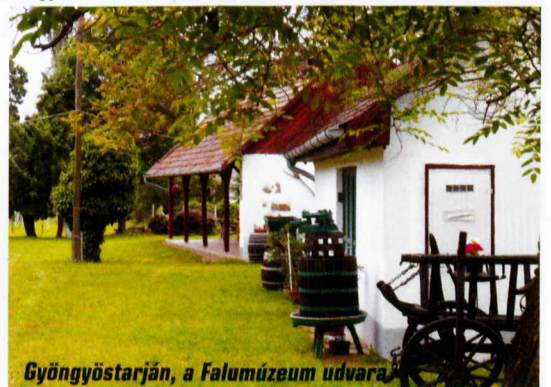
Gyöngyöstarján, a Falumúzeum udvara