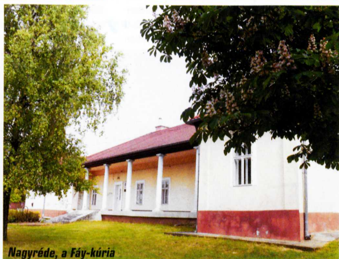
Nagyréde, a Fáy-kúria

Nagyrédét érdemes november első szombatján felkeresni, ekkor tartják az Újbor ünnept. A hangulatos pincesoron sétálva megkóstolhatjuk a finom borokat, magunkba szívhatjuk a friss levegőt és gyönyörködhetünk a Mátra vonulatának panorámájában. A jó borok mellé ízletes ételeket kóstolhatunk, így például a régi receptek alapján készült babgulyást és kemenccs lángost. A zamatos borok mellé jól illenek a Valiskó kecskefarm finom, ízesített kecskesajtjai. Aki részt vesz az őszi eseményen, felejthetetlen élménnyel gazdagodik.