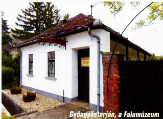
Gyöngyöstarján, a Falumúzeum

A két világháború borzalmi után napjainkban Gyöngyös városa a szőlő és a borkultúra népszerűsítésében