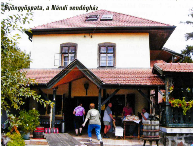
Gyöngyöspata, a Nándi vendégház

A Sósi-réti Borhy-vadászkastélyhoz Gyöngyöstarjából szintén a zöld háromszög jelzésen indulunk, de most jobbra fordulunk a zöld+ jelzésre. Így a faluból egy óra gyaloglás után érünk az 1928-ban készült épülethez. A vadászkastélyt ölelő parkot francia parkok mintájára telepítették, míg a távolabbi erdőt angol mintára parkosították. Láthatunk itt 150–200 éves kocsánytalan tölgyeket, erdei- és feketefenyőket valamint számos egyéb örökzöld és lombhullató fa-, illetve cserjefélélt.