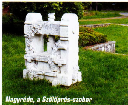
Nagyréde, a Szőlőprés-szobor

A Bormúzeummal átellenben találjuk a Mátrai borboltot, ahol igen kedvező áron juthatunk hozzá a legkiválóbb helyi borokhoz.