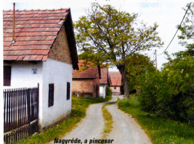
Nagyréde, a pincesor

Gyöngyössolymos látnivalóinak megtekintése után érdemes visszamennünk Gyöngyösre,