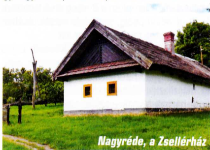
Nagyréde, a Zsellérház

A település nemcsak a szőlőültetvényekben bővelkedik, hanem látnivalókban is. A Szőlőskert Rt. Bormúzeumában a nagyrédei szőlő- és bortermelés történetét ismerhetjük meg. Emellett a szőlőtermesztés és a feldolgozás hagyományos eszközeit, így például dézsát, faprést, darálót, gyöngyösi kapát és rézpermetezőt is láthatunk.