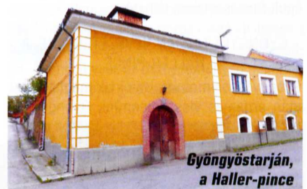
Gyöngyöstarján, a Haller-pince

A falu kedvező földrajzi adottságainak köszönhetően a késő bronzkor óta lakott település. Neve először 1212-ben bukkant fel, amikor II. Endre király adománylevelében a Solymosy Szentisir őrei elnevezésű szerzetesrendnek birtokot adományozott. A község első