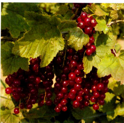
A piros ribiszkéből készült bor friss sillerhez hasonlít

készült, ez utóbbi mennyiségnek sajnos csak kis részét sikerült értékesíteni a pandémia miatt.