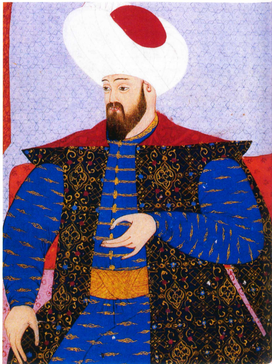
Oszmán Gázi. Az Oszmán-dinasztia és Birodalom névadójának, az államalapító szultánnak későbbi portréja

Eleink és az európai kortársak az oszmán hódítókat törököknek, uralkodójukat „Nagy Töröknek”, országotukat