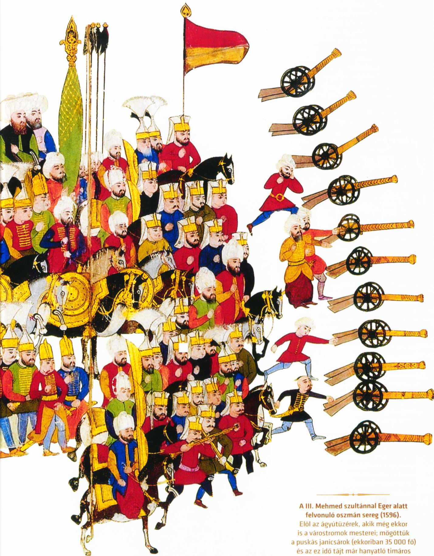
A III. Mehmed szultánnal Eger alatt felvonuló oszmán sereg (1596). Elöl az ágyútüzérek, akik még ekkor is a várostromok mesterei; mögöttük a puskás janicsárok (ekkoriban 35 000 fő) és az ez idő tájt már hanyatló timáros szpáhik. Hátul a szultán és a kísérete látható