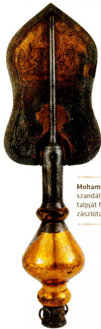
Mohamed szandáljának talpját formázó zászlótartócsúcs

A keresztény és zsidó alattvalók és előkelők megnyerése, a török arisztokrácia semlegesítése és a végvidéki bégeknek a katonai-polgári igazgatásba való betagozása után Mehmed és utódai a muszlim vallástudósokat ( ulema ) is állami szolgálatba állították. Az iszlám birodalmakban a katonaság mellett épp az ulema kiváltságosai (jogtudósok, bírák és a vallási iskolák tanárai) voltak azok, akik az uralkodó hatalmát korlátozhatták, legitimitását vallási alapon megkérdőjelezheték. II. Mehmed azon-