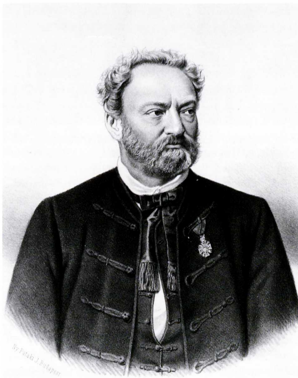
Erkel Ferenc portréja, 1878

A pályázat titkos volt, azaz a komponisták kilétét a zsűri sem ismerhette. Az anonimitást úgy biztosították, hogy a partitúrát idegen kézzel lemásoltatva kellett benyújtani, a kottára pedig a szerző neve helyett szabadon választott jelige került. A lepecsételt borítékba zárt nevek a zsűri döntése után sem hozták nyilvánosságra, így a sajtó csupán a sorszámokat és a jelígeket közölhet-