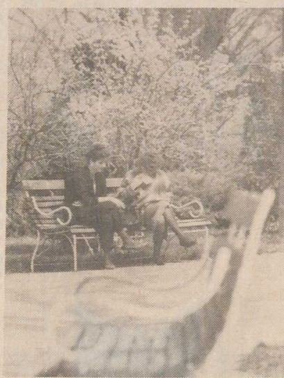
Tavaszi napon a Dimitrov népkertben.

A Mátra kapuja. A szőlő és a bor városa. A 40 ezer lakosú, ezeréves települést, Gyöngyöst, többnyire így nevezik az útkönyvekben, s a Heves megyei város vendégei nyomban érzékelhetik: a természet kegyes volt e vidék szorgalmáról messze földön híres lakóihoz. A Budapest felől érkezők elé csodálatos látvány tárul a tavaszillatú levegőben: a tiszta, kék ég alatt feltűnnek a Mátra hóval borított csúcsai, a települést övező, déli lejtésű, nap-sütötte domboldalakon szőlőtőkékét ápolnak szorgos kezek. Hazánk legnagyobb összefüggő történelmi borvidékén, ahol tüzes színű, különleges zamatú nedűket érlelnek a várost övező pincék hordóiban, gazdag hagyományai vannak e nagy szakértelmet kívánó mezőgazdasági munkának, hiszen 1301-ből származó dokumentumokban már megemlíti az itteni szőlőművelést. A hagyományokat ápolva rendszeresen — így az idén is — megrendezik a Mátrai szüret elnevezésű gazdag program-sorozatot, amely mindig sok érdeklődőt vonz a városba.