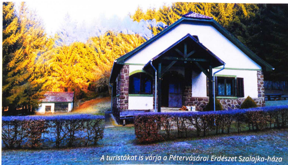
A turistákat is várja a Pétervásárai Erdészet Szalajka-háza

A család Egercsehiben ma is álló kastélya 1830-ban épült. Jelentős birtoka révén (Egercsehi, Bükkszenterzsébet, Tarnalelesz, Szúcs, Bekölce, Mikófalva) az erdők kezelésében és a vadászatban is jelentős szerepet töltött be a család, jól kezelt erdekben számos óriási méretű fa élt. Néhány haldokló famatuzsálem most is látható Szúcs község határában.