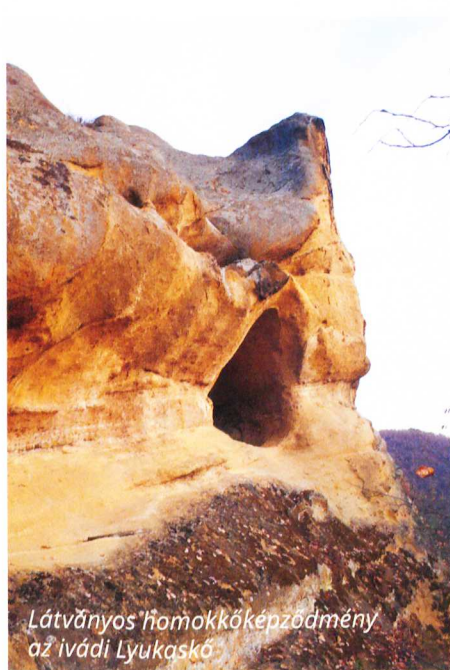
Látványos homokkőképződmény az ivádi Lyukaskő.