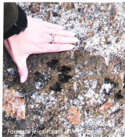
Farkasok jelenlétének látható nyoma