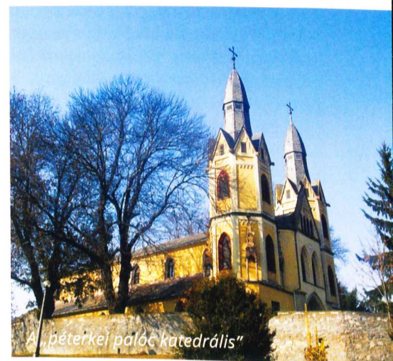
A „péterkei palóc katedrális”