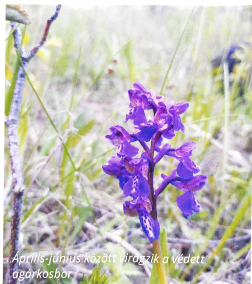
Április-június között virágzik a védett agárkosbor

A mára egybeépült három település: Bükkszenterzsébet, Tarnalelesz és Szentdomonkos határában érjük el a Nagy-kő tanösvényt. A környék egyetlen, páratlan szépségű bemutatóhelye mintegy 7,1 kilométer hosszan vezet a kíváncsi túrázót, és öt állomáshelyen mutatja be a környék élővilágát. A tanösvény végén forrás várja a kirándulókat, pihenőhellyel, kis esőbeállóval. Onnan az Országos Kéktúra útvonalra vezet fel a Leleszi-völgyön keresztül a Vállós-tanyáig, ahol szintén üde vizű, tiszta forráskút vize fakad. A tanya valaha az Egercsehiben székelő Beniczky gróf uradalmának része volt, vadászatai alkalmával használta az épületet. Gróf Beniczky György alapozta meg a csehi szénbányát, miután birtokán 1890-ben már elkezdte a szén kitermelését, majd 1906-ban eladta a bányászati jogot az 1990-ig üzemelt Egercsehi Kőszénbánya Rt.-nek.