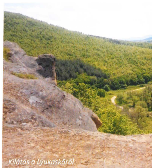
Kilátás a Lyukaskőről