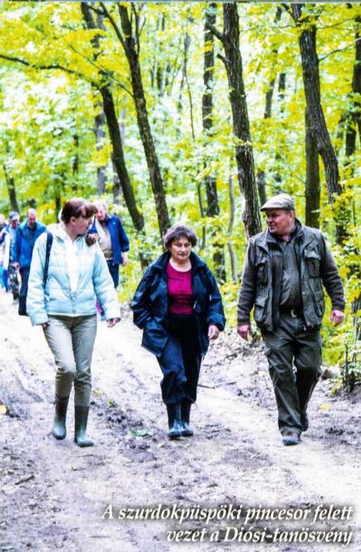
A szurdokpüspöki pincesor felett vezet a Diósi-tanösvény.

partnereként vett részt. A bivak szállásként is használható kilátó nemrég komoly ismertséget szerzett az amerikai Architizer Awards közönségdíjával.