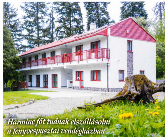
Harminc főt tudnak elszállásolni a fenyvespusztai vendégházban

Sár-hegyi tanösvény, amely Gyöngyös és Mátrafüred felől egyaránt bejárható. Sár-hegy geológiáját, növény- és állatvilágát tanösvény mutatja be, mely a Szent Anna-tavat is érinti, ahol a kis kápolna árnyékában pihenhetnek, és élvezhetik a természet békéjét. A Mátra