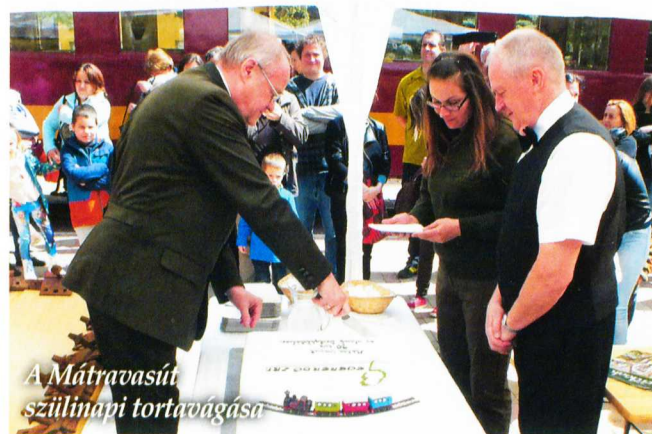
A Mátravasút születésnapi tortavágása