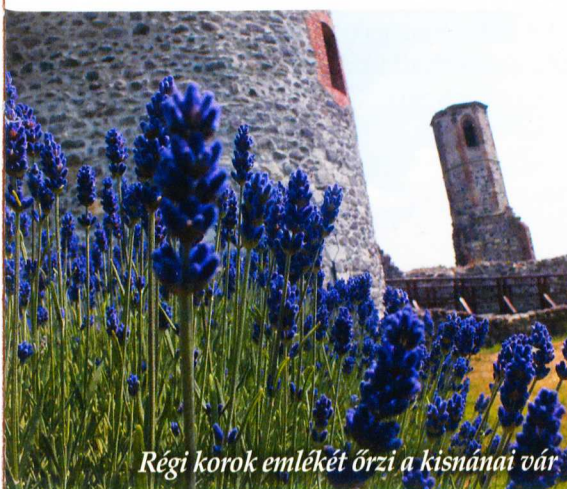
Régi korok emlékét őrzi a kishánai vár

ba a kénes gyógyvíz, a parádsavári név helyesebb lenne, mert ott is palackozzák. A gyomorbetegségek jellegzetes gyógyvize, hatásos a savtúltengéssel járó gyomor- és bélbetegségek leküzdésében, segíti az emésztést, enyhíti a légutak hurutos állapotát, fokozza az epeelválasztást, segíti a máj működését, kedvezően befolyásolja a csontritkulás, szív- és érrendszeri betegségek folyamatait. A túrák során érdemes megkóstolni a parádóhutai Klarisszacsevica, vagy az Ilona-völgyi Szent István-csevica vizét is. Bükkszéken pedig az egészen más összetételű Salvus gyógyvíz található. A település gyógyfürdője is kellemes kikapcsolódást, feltöltődést kínál.