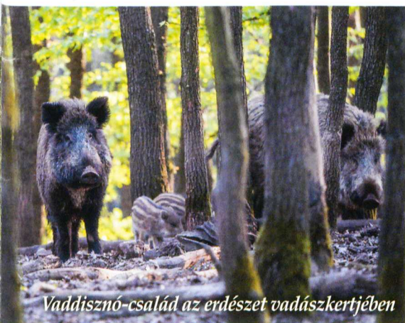
Vaddisznó-család az erdészet vadaskertjében