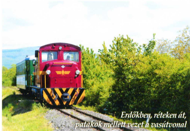
Erdőkben, réteken át, patakok mellett vezet a vasútvonat

Az erdei vasút másik fővonala Gyöngyössolymoson keresztül a Szalajkához szállítja az utasokat. A vonatozás