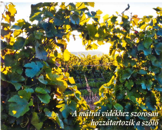
A mátrai vidékhez szorosan hozzátartozik a szőlő

Galyatetőn, az ország egyik csúcspontján magasodó Galya-kilátót a Galyatetői Turistacentrummal együtt tavaly adták át. A különleges programban az EGERERDŐ Zrt. a Magyar Természetjáró Szövetség konzorciumi