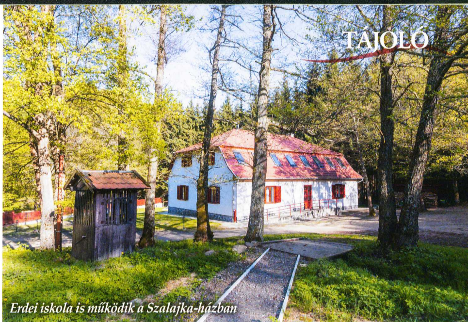
Erdei iskola is működik a Szalajka-házban

Az egykori fűtőház és a Cserkő-bánya után ismét a patak mellett kanyarogva, virágos réten át a Cserkő megállónál hatol a vonat az erdőbe. A Cserkő-tó a környékbeliek kedvenc kirándulóhelye. A továbbra is a patakot követő, napsütötte tisztásoktól, andezit sziklarajzoktól változatos erdei szakasz a vasútvonal legszebb része. A lajosházi megállótól jól jelzett turistautakon, gyönyörű tájakon könnyen eljuthatunk Mátraházára, a sástói kempinghez, valamint a már felszedett egykori vasút-