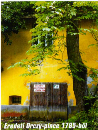
Eredeti Orczy-pince 1785-ből

Végezetül egy látványos, remek programra hívom fel olvasóink figyelmét. Minden év május közepén rendezik meg a gyöngyösi Fő téren a Mátrai Bornapokat, és ezzel egy időben Farkasmályon az „lvó-napi pincejárást”, aminek keretében bordanokok szórakoztatják a vendégeket.