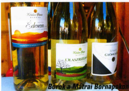
Borok a Mátrai Bornapokon

Az államosítás nem kedvezett Farkasmálynak sem, az 1990-es évek elejére elhanyagolt völgyként már csak a pincelyukak hirdették az egykori szép élet nyomait. Napjainkban azonban