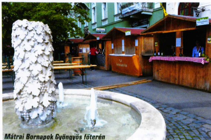
Mátrai Bornapok Gyöngyös főterén

illik a piros szamócató. A kékfrankos–cabernet saugvinonhoz a Mátrában található rengeteg patkó látványa társul. A bársonyos hárslevelűhöz jól passzol a Mátra ásványkincseit mutató címke. A Zsizi gyöngyözőbor címkéje a mátrai csipkebogyókat szimbolizálja. A Sziget Fesztiválok