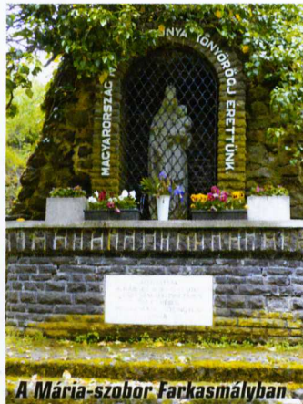
A Mária-szobor Farkasmályban