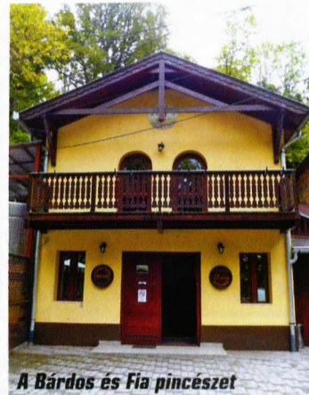
A Bárdos és Fia pincészet

„...ott, ahol a század elejétől 1888. évig vígan dalolt a szüretelő nép, ott, ahol poharak csengése és elmés köszöntők között csapongott a kedély, ezer és ezer akószámra hevert a drága nektár, ott az 1900. évig csendes, mélabús volt minden. Üresek voltak a pincék, búskomoran jártak a szőlőtulajdonosok.”