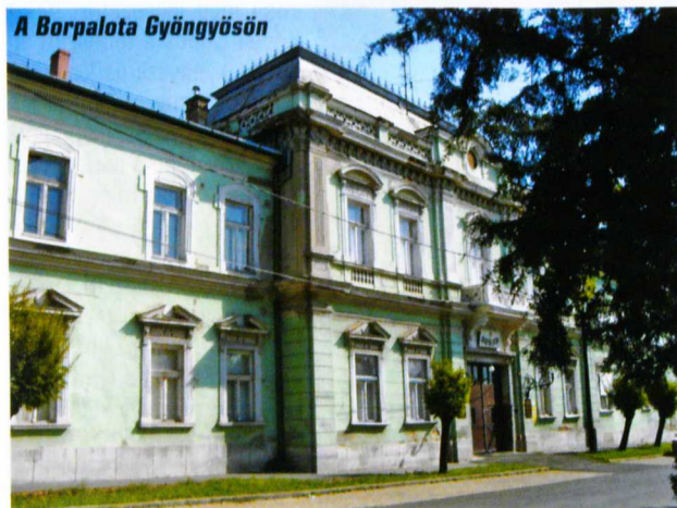
A Borpalota Gyöngyösön

A török uralom alatt a város szultáni birtok volt, ebben az időszakban a város fejlődése megtorpant, de a szőlőművelés fennmaradt. Ekkor terjedt el a török szőlő, aminek vörösborra nagy hasznát hozott Gyöngyösnek.