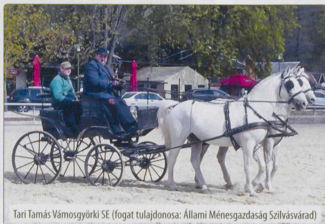
Tari Tamás Vámosgyörki SE (fogat tulajdonosa: Állami Ménesgazdaság Szilvásvárad)

Teret kapott mondanivalójában a fogathajtó sport népszerűsítése is, valamint az a gondolatmenet, hogy nyugati mintára