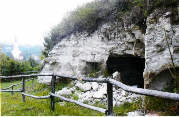
Cserépfalvai barlangüregek és a környék

lent, amely horzsakövet is tartalmaz. Keletkezése a heves robbanásos kitörések vagy vulkánösszeomlások során kialakuló rendkívül magas hőmérsékletű izzó hamufelhőkhez kötődik, amelyek lejtőirányba igen nagy sebességgel mozognak, s mint egy pokoli izzó áradat, mindent letarolnak és megsemmisítenek, ami az útjukba kerül. A hamufelhő anyaga végül nagy területeket befedve, tufaszőnyeget alkotva ülepedik le, amely aztán többé-kevésbé – általában kevésbé – összesül.