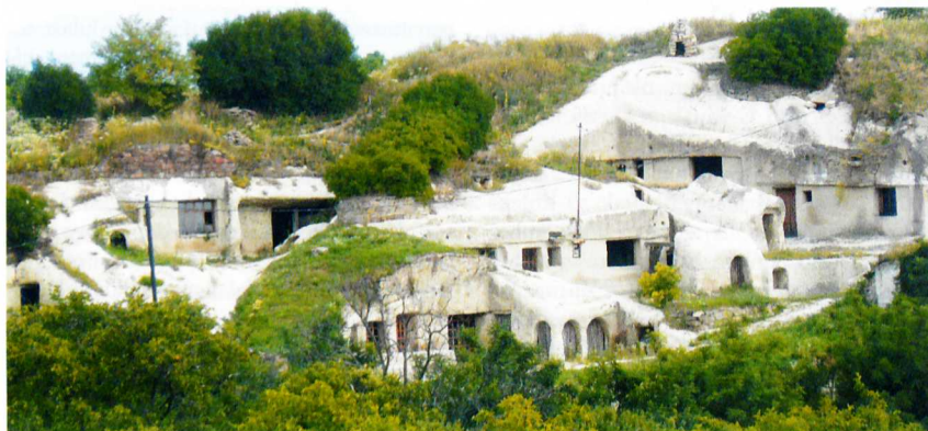
A noszvaji barlanglakások madártávlatból

A Bükkalján összesen 73 kaptárkó található, a fülkék száma eléri az 500-at. A legtöbb Szomolya község közelében van, 13, amelyek közül legjelentősebb a községtől nyugati irányba emelkedő hegy oldalában kibukkanó, 8 tagból álló sziklacsoport. Itt