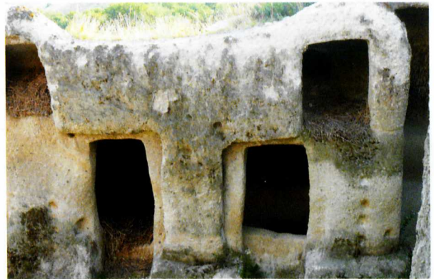
Részlet a noszvaji „barlanglakás-nyegyedből”

lódását mutatja, a képződmények kora a 20 millió évtől 13 millió évig tart. A heves és hosszú ideig elhúzódó tűzhányó tevékenység következtében a képződmények egykor a Bükk teljes területét befedték, s a hegység karbonátos üledékek (mészakövek) csak a vulkanizmus megszűntét követően, a szarmata korszak végétől kezdve kezdtek el kihantalódni (s az ott jellemző karsztosodási folyamatok is nyilvánvalóan ettől az időtől kezdődhetnek legkorábban). A lepusztulás iránya déli volt, így a Bükkalján lévő riolitufa-rétegsor itteni nagy vastagságához nyilvánvalóan a magasabb területekről lehordott kőzetanyag mennyisége is jelentős mértékben hozzájárul. A riolitufa-előfordulást tekintve nemcsak vastagságában, hanem kiterjedésében is vezet a Bükkalja: itt jött létre a legnagyobb, legösszefüggőbb ignimbrit-plató, nyugat-keleti irányban mintegy 40, illetve észak-déli irányban 10–15 kilométer kiterjedésben. A platót a hegységből lefutó vízfolyások völgyei észak-déli irányú háttakká tagolják, amelyek laza, nem összesült ignimbritből álló oldaliban rendkívül látványos sziklaképződmények: meredek piramis vagy cukorsüveg formájú kőtornyok bukannak elő, amelyekbe a régmúlt idők emberei egyes feltevések szerint méhészkedés