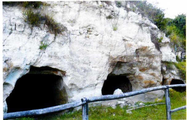
Egykori barlanglakásrészlet Cserépfaluból

zajlott, ami meghatározta a tájkép alakulását. A középső miocén szarmata korszakában speciális képződmény, ún. lavinatufa keletkezett. A savanyú, viszkózus kőzet a meredek vulkáni lejtőn lavina formájában zúdult le, majd a tűzhányó előterében nyelvek formájában halmozódott föl. A boldogkőváraljai riolittufanyelv több tufaszórás és lavinyszerű tufazúdulás eredményeként jött létre, vastagsága megközelíti