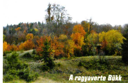
A ragyaverte Bükk

Miután leszurkoltam az 500 forintot, felziháltam a kilátószintre. Állítólag 13 falut lehet látni onnan. Nem számoltam. Nekem az ígért Tátrából Mátra