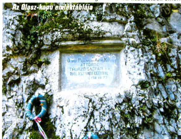
Az Olasz-kapu emléktáblája

a szerző a Szigethalmi TE tiszteletbeli elnöke