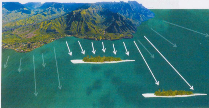
2. ábra. Robert H. MacArthur és Edward O. Wilson szigetbiogeográfiai elmélete alapján nem csak a szigetek mérete (fent) alakítja ki a szigetek fajszámát, hanem azok távolsága is a szárazföldtől (lent): a szárazföldhöz közeli szigetekre több faj jut el, mint a távoliakra (így a távoliak diszperzió-limitáltabbak).

álláspontja is úgy nagyjából a 2000-es évekig. Azonban az utóbbi két évtizedben folytatott kutatások rávilágítottak, hogy ez koránt sincs így. Hogyan lehetséges ez? Elsősorban a kisvizek hatalmas számának köszönhetően — Nagy-Britanniában, Dániában és Svájcban készült felmérések alapján ezen országok állóvizeinek több mint 97%-át kisvizek adják! Ennek révén tudnak jelentősen hozzájárulni a biodiverzitáshoz, élőhelyet biztosítva nem csak a kizárólag kisvizekben előforduló élőlényeknek, de azoknak is, amelyek a nagyobb tavakban vagy folyókban is megtalálhatók. Egy tanulmány azt is kimutatta, hogy a kisvizekben világszerte tárolt szén biomaszája messze meghaladja a világoceánban találhatóét, ezáltal a globális folyamatokban is igen je-