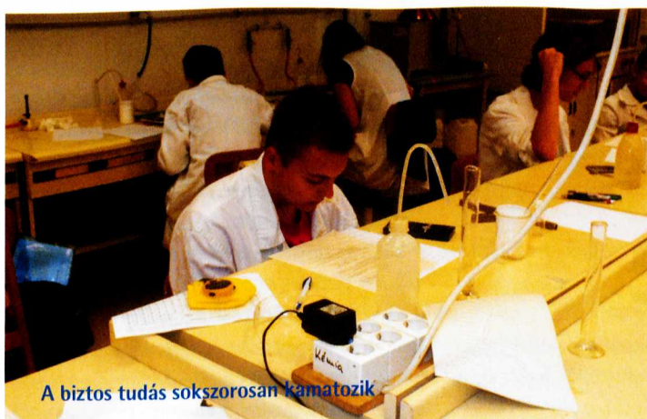
A biztos tudás sokszorosán kamatozik