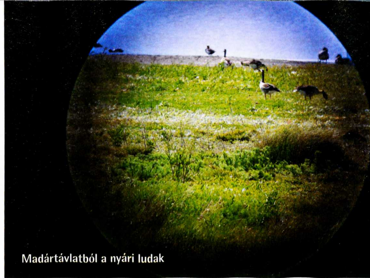
Madártávlatból a nyári ludak

környéke volt. A résztvevők egy időutazás részei is lehetnek; a földtörténet évszázmilliókat idéző múltjától a jelenkori növény- és állatvilágok megismeréséig tartó szellemi iv sok érdekességet is kínált. A tesztfeladatok megoldásának végeredménye még a szigorú zsűri elismerését is kiérdemelte.