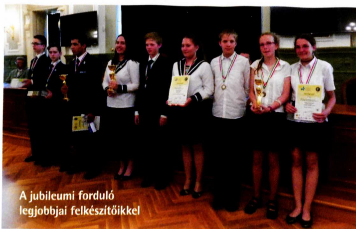
A jubileumi forduló legjobbjai felkészítőikkel

A háromfordulós megmérettetés az elméleti fordulóval, a tesztfeladatok megoldásával kezdődött, majd terepgyakorlattal folytatódott, amelynek helyszíne a Fertő tó közvetlen