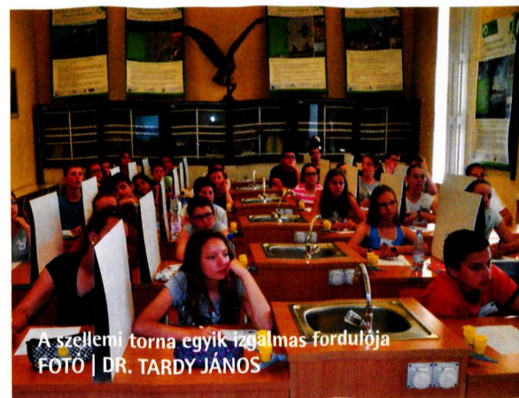
A szellemi torna egyik izgalmas fordulója