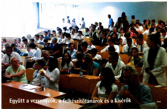
Együtt a versenyzők, a felkészítőtanárok és a kísérők ...