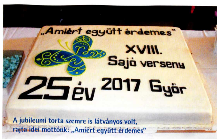
A jubileumi torta szemre is látványos volt, rajta idei mottónk: „Amiért együtt érdemes”