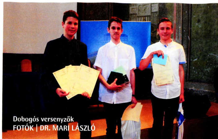
Dobogós versenyzők