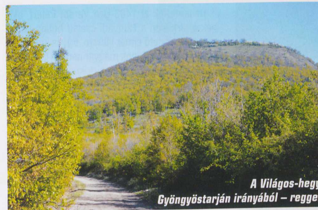
A Világos-hegy Gyöngyöstarján irányából – reggel

Khalkédón város nevéből származik. A kvarccal azonos kémiai-fizikai tulajdonságokkal rendelkezik, az anyaga szintén SiO 2 , szilícium-dioxid. A kalcedon kovasavban gazdag, nem magas hőmérsékletű, 50–200 Celsius-fokos hidrotermális oldatok munkája során rakódik le, települ be üregekbe, ahol rétegeket vagy konkréciókat – zárványokat – alkot. Magmás és üledékes kőzetekben is megtalálható. Errefelé a gömbösfürtös előfordulása a leglátványosabb.