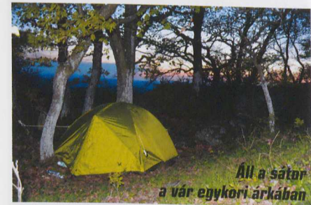
Áll a sátor a vár egykori árkában

Jól emlékeztem arra, hogy a jelzett út nemcsak meredek, de egy helyen kézzel is segíteni kell a szint leküzdésénél. A Kőmorzsás-tető után, a Nagy-lénia enyhe lejtőjén végre kimegekedtem a terhem cipelésében. Ez egyszer jól esett! Utol-