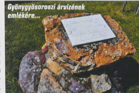
Gyöngyösorszi árvízének emlékére...

Összeszedtem magam, és besétáltam Gyöngyösre – ezt a szakaszt 40 év után először tettem meg gyalogosan. A város számos érdekes műemlékét nehéz lenne ehhez a cikkhez kapcsolni. Legyen most elég a Mátra ércbányászati vidéke – a hegység kiemelt magaslatai mellett ez is több látogatóra – vagy gyűjtőre – érdemes.