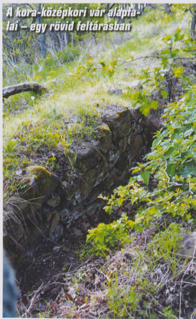
A kora-középkori vár alapjai – egy rövid feltárástól

Déli irányban egy elenyedetett teraszon halad a gyalogösvény, és íme – valakik kiástak egy öt méteres falszakaszt! A fal a középkori várakra jellemző nagyságú kövekből volt rakva. A szakértők a felső vártól a déli erődítményrészig négy részre osztják a Világos-várat. A 48 méter hosszú felső vár után, egy kettős árkot követően jön a 68 méter hosszú első elővár, majd egy keresztirányú árok után a 14 méteres második elővár. A 90 méteres harmadik elővár szélei már elmosódtak a keleti oldalon. A turistaút – ha jól sejtem – a második és harmadik elővár közötti, sziklába vágott árkon halad át. A vár védett