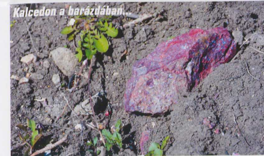
Kalcedon a barázdában

A kalcedon a mikrokristályos kvarcok változatainak gyűjtőneve – a kifejezés a kisázsiai