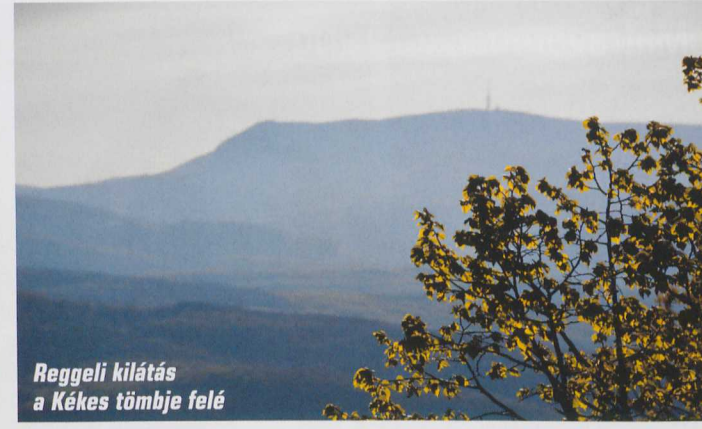
Reggeli kilátás a Kékes tömbje felé

Elhatároztam, hogy begyalogolok Gyöngyösre – 4,5 kilométer és még másfél a buszpályaudvarig. A falu végén is láttam egy valamikori víztározót, ez sem lehet mérgegmentes. Behúztam, és a ligetes völgyben egy óra alatt a Gyöngyösről Szurdokpuszpóki felé vezető úthoz