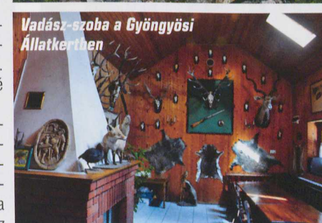
Vadász-szoba a Gyöngyösi Állatkertben