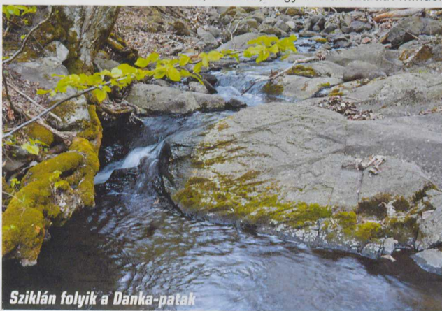
Sziklán folyik a Danka-patak

Én viszont a Vár-hegyre indultam. A kis hegy medrek oldalában három szinten sorakoztak szorosan egymás mellett a legkülönfélébb „minőségű” présházak. Sajnos egészen