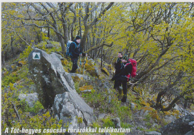
A Tót-hegyes csúcsán túrázókkal találkoztam