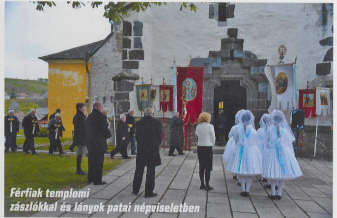
Férfiak templomi zászlókkal és lányok patai népviseletben

vendégként szinte ajándékképpen lehettem ezen az ünnepélyes helyen. Még csak néhányan ültek a padokban, serényen fényképeztem. Közben köszöntem a mosolygónak – visszaköszöntek. A sok részlet között volt fejet formázó gyámkő, bíborosi látogatás emléktáblája, ősrégi szenteltvíztartó és egyebek. A szentélybe, a Jessze-fára sárga ablaküvegeken szűrődött be a fény, kiemelve a hely jelentőségét.