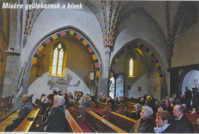
Misére gyülekeznek a hívek