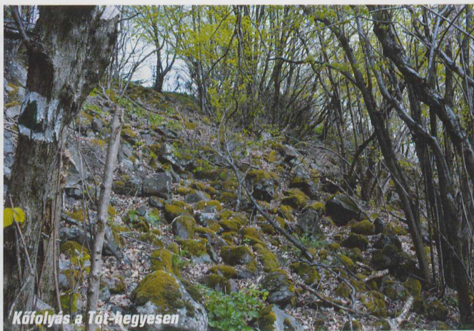
Kőfolyás a Tót-hegyesen