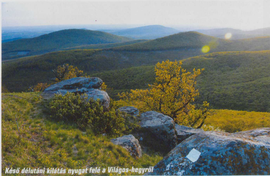
Késő délutáni kilátás nyugat felé a Világos-hegyről

lehetnek, mert nagyon tartózkodóak voltak velem. Mikor rácsodálkoztak, hogy éjjel sátorban fogok aludni, kaptam az alkalmon, és előadtam a sátrazás előnyeit, ami elsősorban a fotósoknak előnyös, no meg sokat lendít az általános hangulaton. Előttük volt a jó példa.