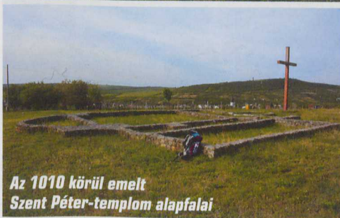
Az 1010 körül emelt Szent Péter-templom alapfalai

szült ki. A patai népviselet 2018-ban a Heves Megyei Értéktárba is bekerült.