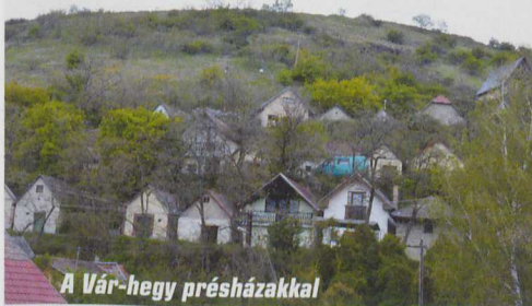
A Vár-hegy présházakkal

Utamat a sárga keresztben folytattam, és felkaptattam a Mész-pest nyúlványára. Egyszer csak megelevenedett a bozótos, és 10–15 óz szaladt el egymást lökdösve az úttal