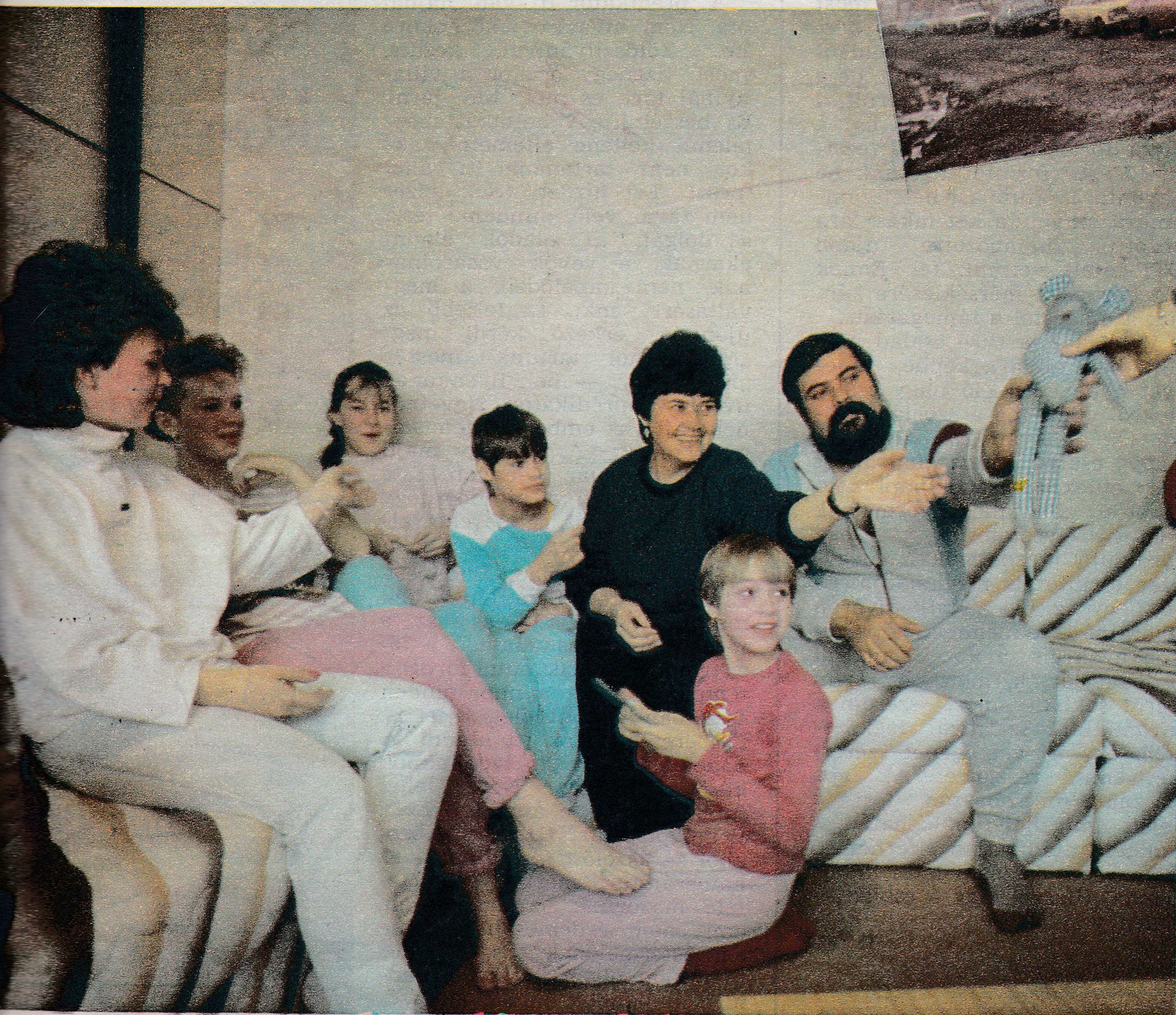
Hét végén együtt van a népes család

Azelőtt egy égbenyúló toronyház fogadta Gyöngyös határában az érkezőket. Ma ez a dán stílusú lakótömb a legvárosszerűbb ház