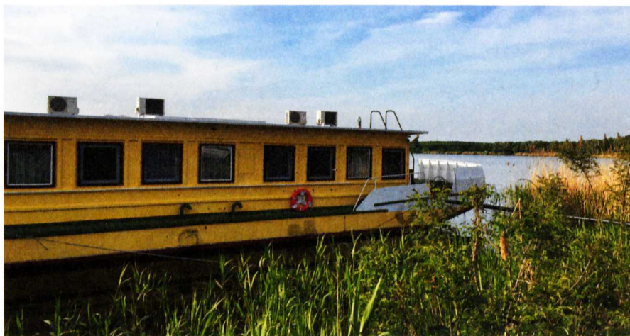
Egy valódi tavi öko-szálláshely: az abádszalóki Tündérfátyol Szállodahajó

A Tisza-tó szolgáltatásainak kialakítása a 2000-es évek második felében vált intenzívvé. A régió 1998-ban lett kiemelt üdülőkörzet, megalakult a túraközpont-hálózat, és aktív TDM-egüttműködés kezdődött. 2010-ben megérkezett az első nagy nemzetközi siker, mivel a tó elnyerte az Európai Bizottság „Kiváló Európai Desztinációk” díját [Turizmus Online, 2010]. 2012-ben megnyílt a poroszlói Ökocentrum, mely már a megnyitás évében 155 ezer látogatót fogadott, ez a szám 2018-ban meghaladta a 220 ezret [heol.hu, 2018]. Ahogy az egész Tisza-tó, úgy az Ökocentrum is egy komplex szolgáltatásokat kínáló, számos érdeklődést kielégítő létesítmény. Központi eleme a 735 ezer literes édesvízű akvárium, a kiállítás mellett számos hullót és kételtűt mutat be, valamint hangsúlyosan tartalmazza a Tisza-tó élővilágának részleteit. Az Ökocentrum egyik fő célkitűzése a gyakorlati oktatás megvalósítása, melyhez előadóterem és egy nemrég korszerűsített háromdimenziós vetítőterem is kapcsolódik. Az Ökocentrum