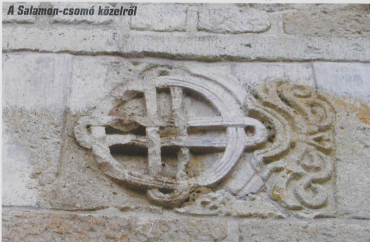
A Salamon-csomó közelről