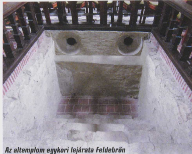
Az altemplom egykori lejárata Feldebrőn

a szerző a Szigethalmi TE tiszteletbeli elnöke