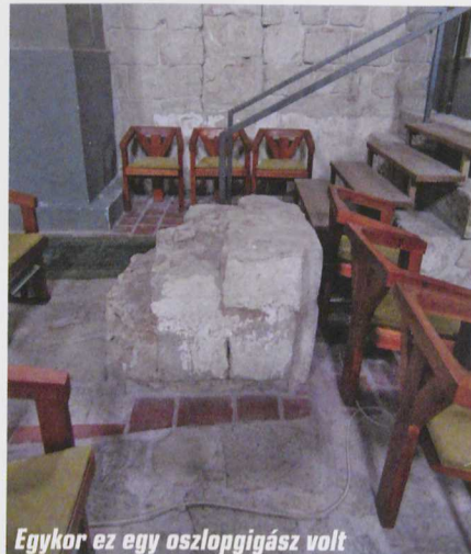
Egykor ez egy oszlogigász volt

Ilyenkor a faluban a ház elé virággal díszített széket raktak eleink, hogy az áldott állapotú Mária illő módon pihenessen meg, ha véletlenül erre járna.