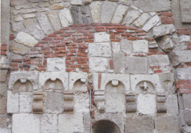
Vegytiszta romanika (Feldebrő)