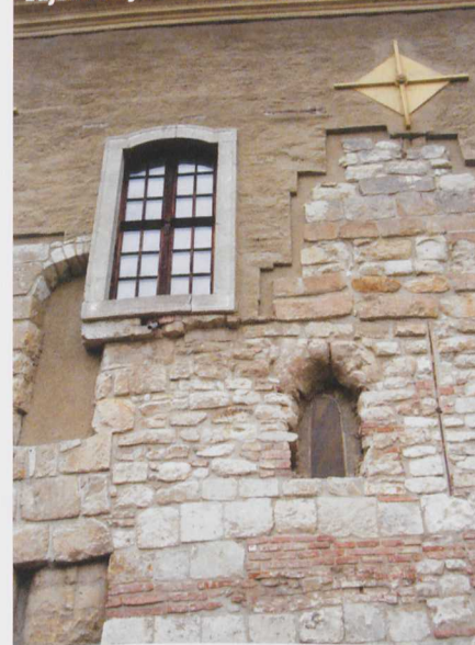
Vajon melyik ablak az ősibb?

foltt, de úgy, hogy a foltok szinte kiabálnak a nagy eltéréstől. A bejárat és környéke vegytiszta barokk, de ahogy körbejáród, a romanika és a gótika is elő-elővillan. Van olyan húsz négyzetmétere a falnak, ahol a három stílust egyben láthatod. Miért ilyen eklektikus a templom külseje? Akárcsak a településnek, a templomnak is zaklatott élete volt.