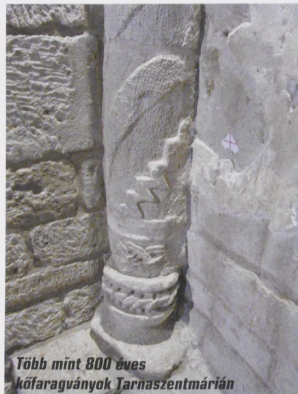
Több mint 800 éves kőfaragványok Tarnaszentmárián

múlva ott vagyokja volt hallható a telefonban. Ilyenkor az idő relatívá válik, hol 5 perc, hol 60 lesz a 10 percből. A léha semmittevés helyett körbejártuk a templomot.