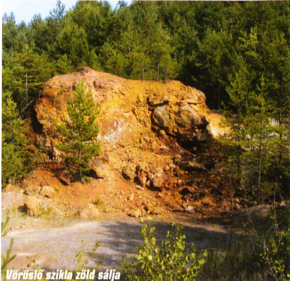
Vöröslő szikla zöld sálja