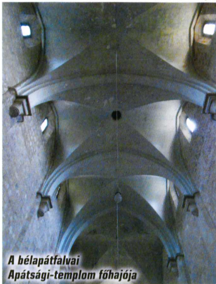
A bélápátfalvai Apátsági-templom főhajója

Amikor legutóbb itt jártam, csak kívülről láthattam a templomot. Elvárásolt a romanika és a gótika együttes jelenléte. Mi ennek a fura