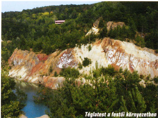
Téglatest a festői környezetben