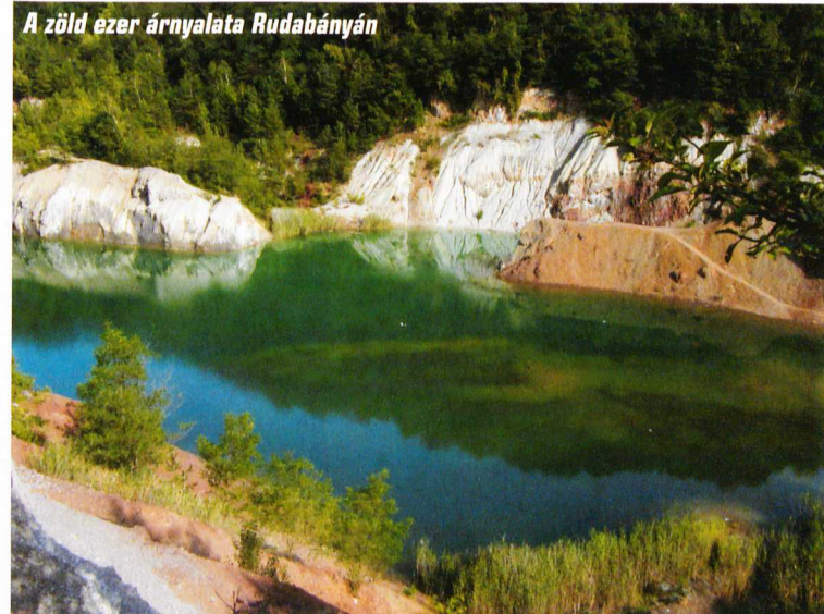
A zöld ezer árnyalata Rudabányán