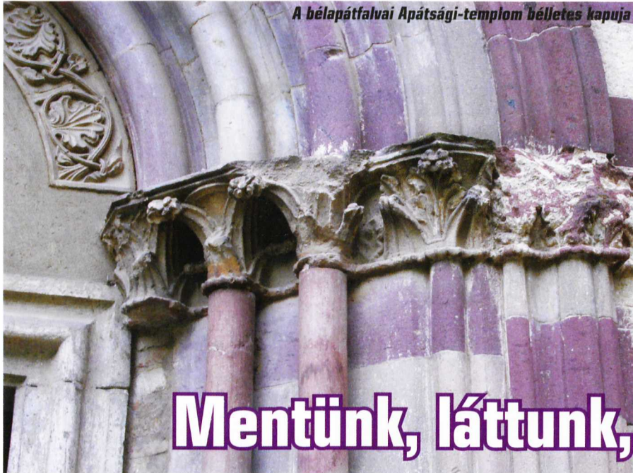
A bélápátfalvai Apátsági-templom békletes kapuja