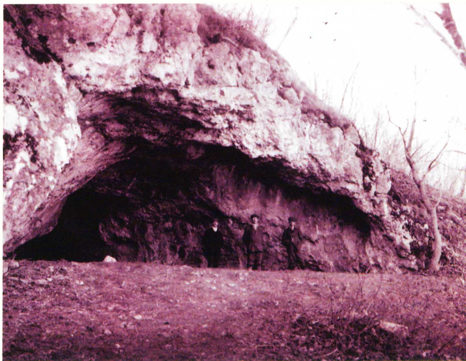
Az 1912-es év döntő jelentőségű volt a Pilis-hegység kutatási történetében. Korabeli felvételen a feltárás előtti Kis-kevélyi-barlang látható

Látjuk ezekből a példákban, hogy az őskor rejt még a tudomány számára bőven titkokat és további felmerülő kérdéseket. Ezekben a barlangokban élt az akkori ember, tágas üregeit betöltötte zokogása, ha szomorú volt, vagy éppen a nevetése, táncának,