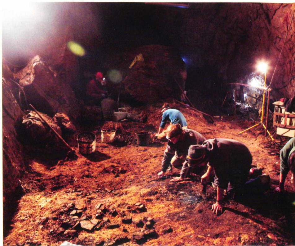
A régészek számára nagyon nehéz elhatárolni egymástól a különböző korszakokat, és nem is minden barlangban találjuk meg mindhárom kor legjellemzőbb leletanyagát