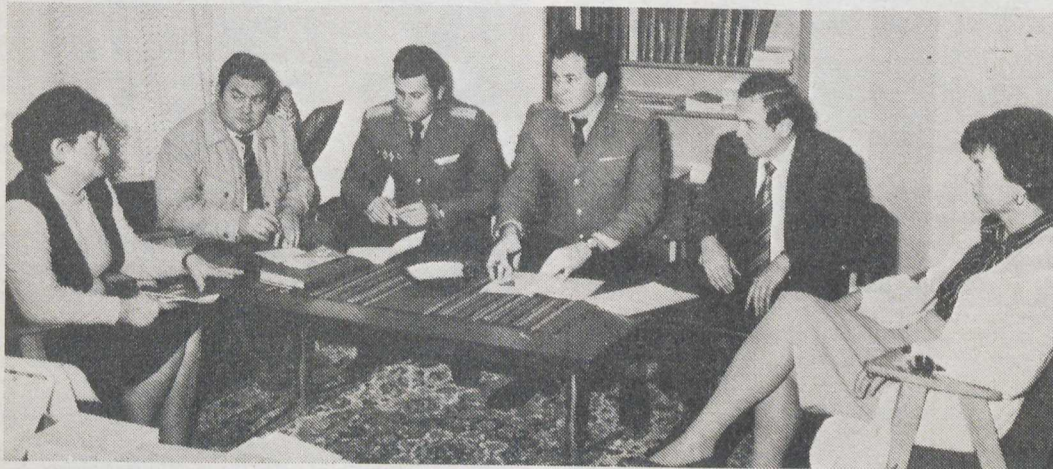
Koordinációs értekezlet a megnyitó előtt