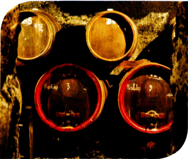
→ A KISTÁLYAI ÚTI CSUTORÁS-PINCÉBEN HAGYOMÁNYOS MÓDON ÉRLELŐDNEK A BOROK, TÖBBSÉGÜKBEN 5 HL-ES HORDÓKBAN

Az Almagyar dűlőt az érseki szőlőskert vesszőiből készített oltványokkal ültették be, és erről fogják majd visszatelepíteni ugyanezt a megmentett antik szőlőfajtát az Érseki dűlőre. Izgalmas kísérletről van tehát szó, amely egyfajta mentőakció is. A történet kísértetiesen