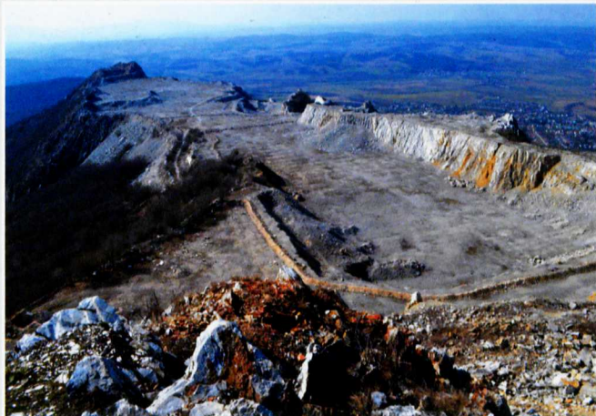
A holdbéli tájra emlékeztető bányaudvar, amely egykor a hegy Béli-medence fölé magasodó gerince volt