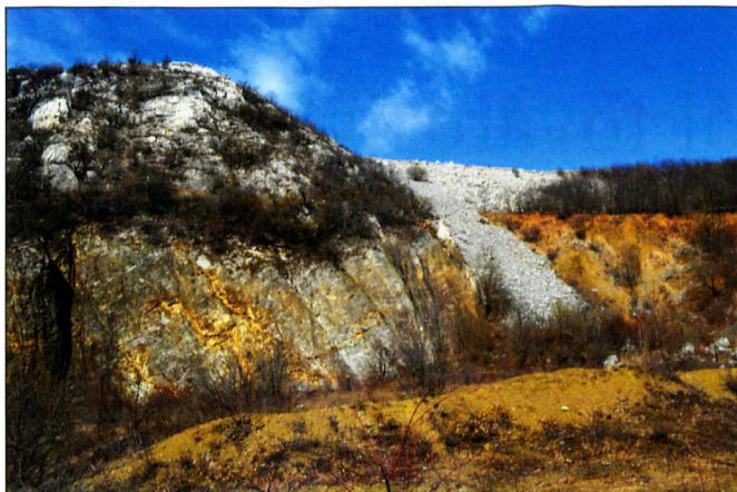
Palabánya az ejtőaknával és kifolyóval

heti. A 90 évig működő cementgyár és mészegető kőbányászata a hegy felszínét teljesen átalakította. Az egykori tarajos sziklagerincet helyenként csaknem 90 méter vastagságban lefejtették, az északnyugati lejtőket pedig lépcsőkkel tagolták.