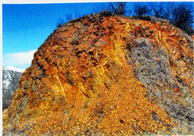
A párnalávából felépült Szász-bérc