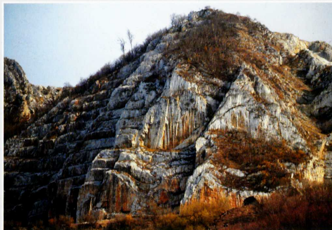
Néhol kis fantáziával még fel lehet fedezni a bányászat előtti felszínformákat is