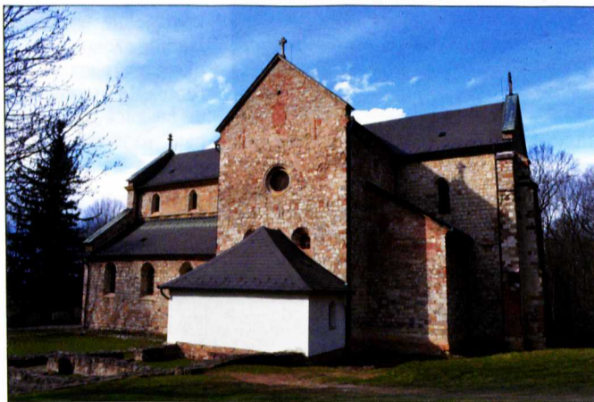
A cisztercita apátság eredetileg a bél nemzetség családi monostora lehetett

A megtépett sereg a sziklás bércek között táborozott le. Sem ételük, sem italuk nem volt. A király volt a leggyengébb, a legbelebtegg köztük. Tikkasztó szomjúság kínozta, de senki sem tudott vizet adni... Egy Beél nevű szikár legény azonban fogadalmat tett, hogy a föld alól is kerít vizet a királynak. Hosszas barangolás után a sziklák között rátalált egy forrásra, ahonnan sikerült vizet hoznia. A király megköszönte Beél önfeláldozó tettét, s méltó jutalmat ígért. Miután a tatárok kitakarodtak az országból, IV. Béla király magához hívatta és egy adománylevelet nyújtott át neki.” A legenda szerint így került a hegy és környéke a Bél nemzetség birtokába. A hatalmas kőbérce, amelynek aljában a forrás volt, azóta nevezi a nép Bél-kőnek.