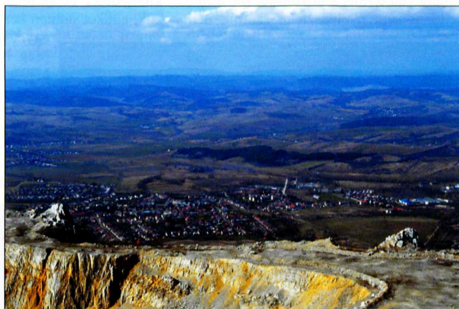
Belpátfalva látképe a Bél-kő csúcsáról

Indulás előtt érdemes lesétálni az település felőli parkolóba, mert onnan nyílik a legjobb rálátás az apátság és a hegy együttesére. A tanösvény nagyobb részt az egykori kőbányába vezet útton halad. Felférve a csúcsra a környék csodálatos pano-