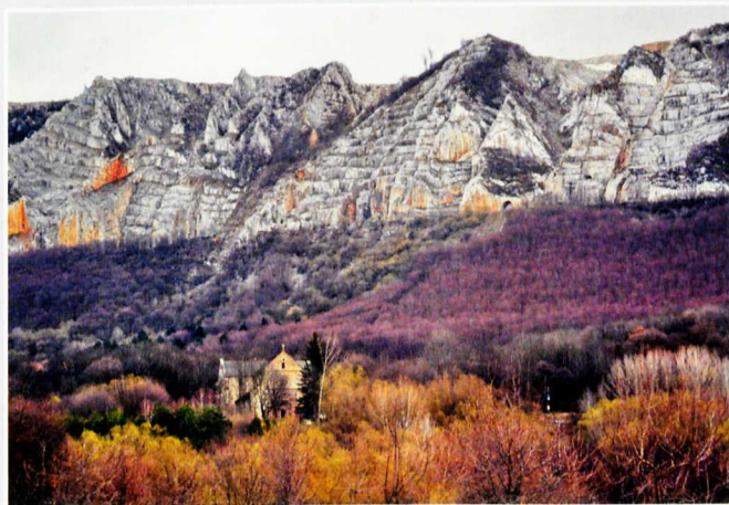
A Bél-kő látképe az apátsági templommal