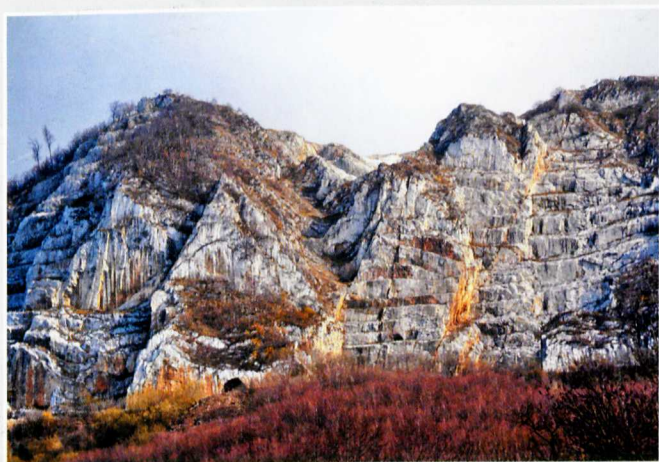
A mészkő lépcsős bányászata jellegzetes „ráncozat” mélyített a hegy „homlokára”