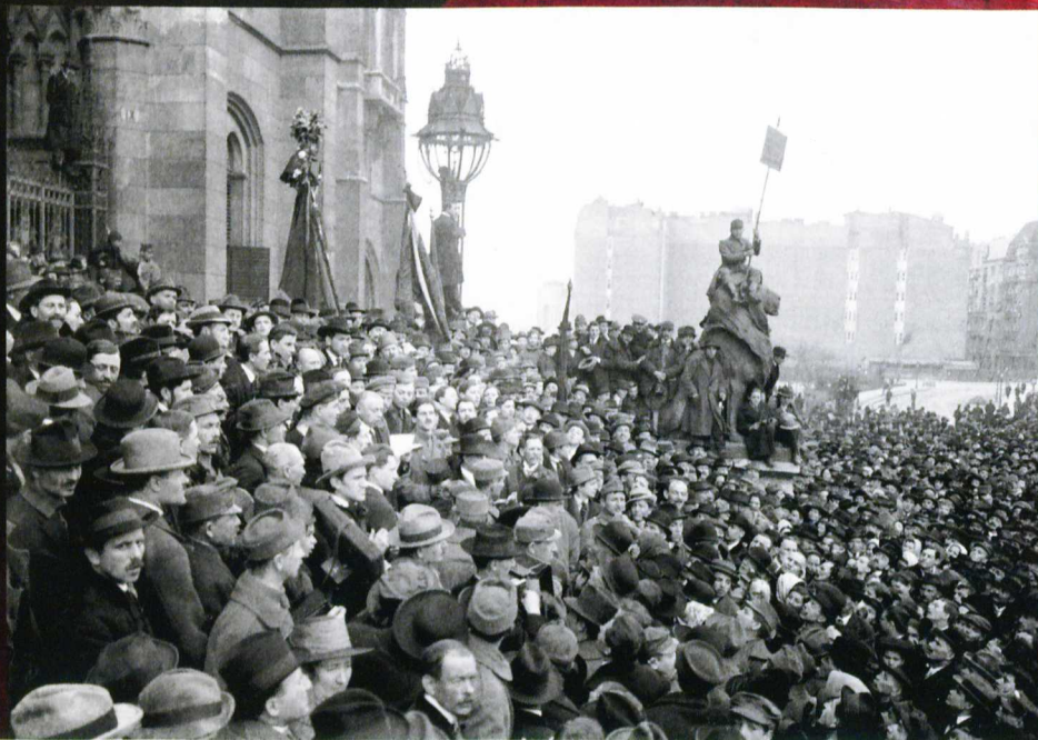
Kun Béla beszél a Parlament előtti tömeggyűlésen 1919. március 23-án JOBBRA: A proletár-hatalom célzott programja révén munkásgyerekek is nyaralhattak a Balatonnál 1919 júliusában