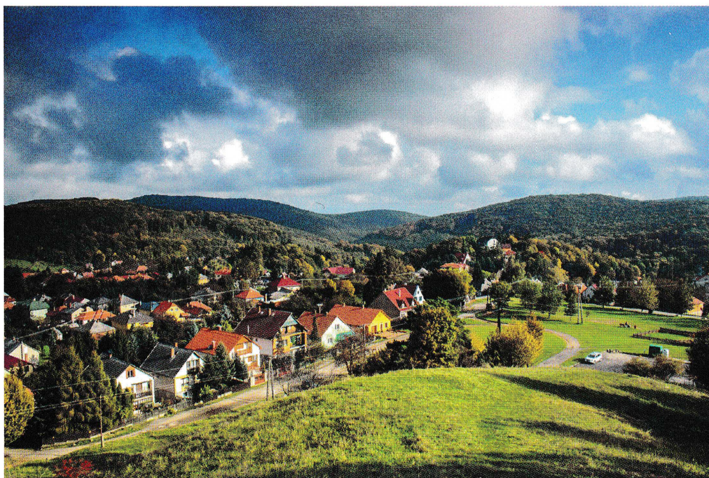
Bükkszentkereszt és a Bükk a kilátóból nézve