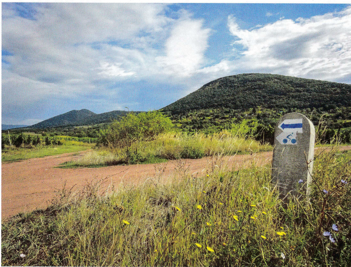
A legendás Nagy-Eged Eger határában