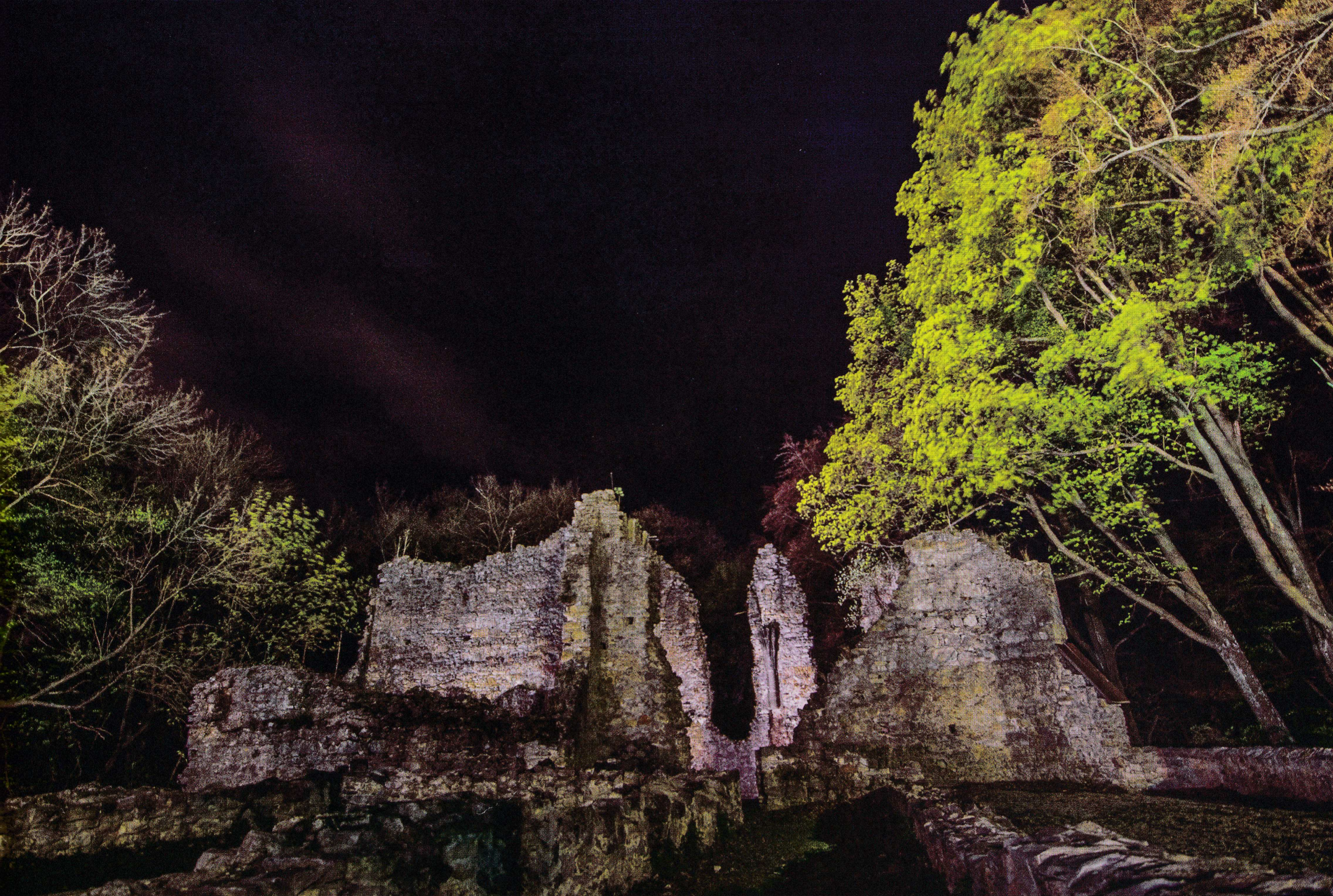
A kolostorromot jelenleg állványokkal támasztották meg. Kétségtelenül eljött az ideje egy átfogó renoválásnak – Fotó: Gutter Krisztián

találunk. Hazánk gótikus műemlék romjainak sorában igen jelentősnek számít az 1300-as évekből származó templomrom, amelynek tőszomszédságában turistaház is üzemel, amely frissítővel vagy akár szállással is szolgálhat a vándoroknak. Jelenleg a látványos kolostorromot állványokkal próbálják megtá-