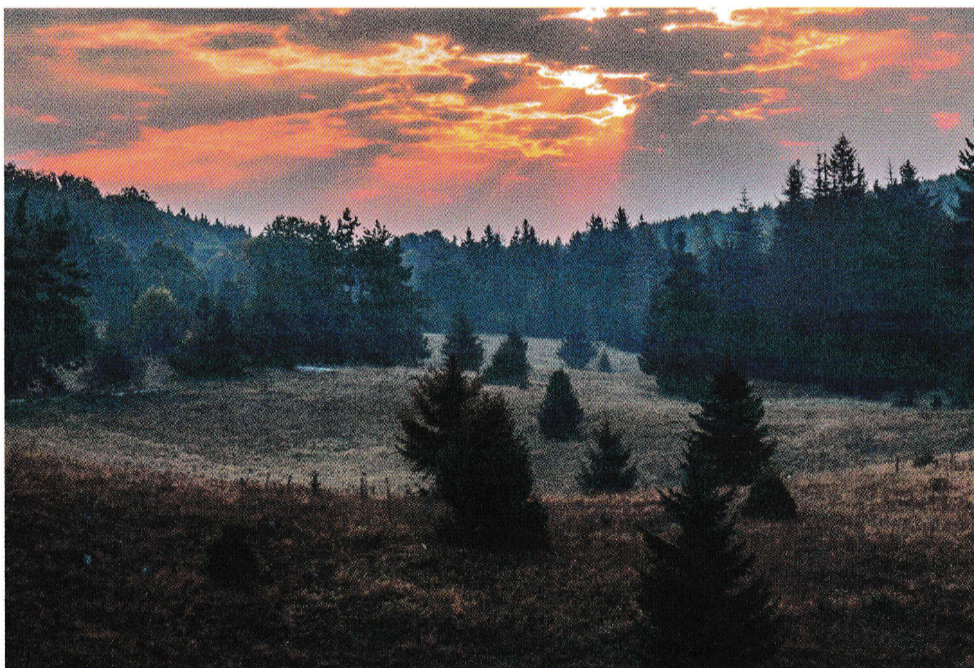
A Bükk-fennsík minden évszakban festői

Az Őr-hegy megmásítása után elhaladunk a Dorongosi-víznyelőbarlang mellett, majd egy erdészeti utat követve érjük el a szebb napokat látott Ilona-kutat és a közeli Ilona-házat. Sajnos a 2017. áprilisi havazás és az erdészeti munkák miatt utunknak ez a szakasza nem tartozik a szép részek közé. A Sügér-völgy kanyargós – nyáron csalános – szorosán érünk ki a Tebe-pusztára, amelynek hangulata hasonlít a Bükk-fennsík varázslatos környezetéhez. Sátorozásra, piknikezésre csábító, idilli kaszálók mentén haladunk a Hór-völgy bejáratához, de utunk mégsem a látványos szurdokvölgyben, hanem a Derecske-lápán emelkedik a felújított és szállást adó Pázsag turistaházhoz. Továbbgyalogolva fel-le hullámvasutazunk, mígnem a Kós-völgy és a Kis-kút-völgy