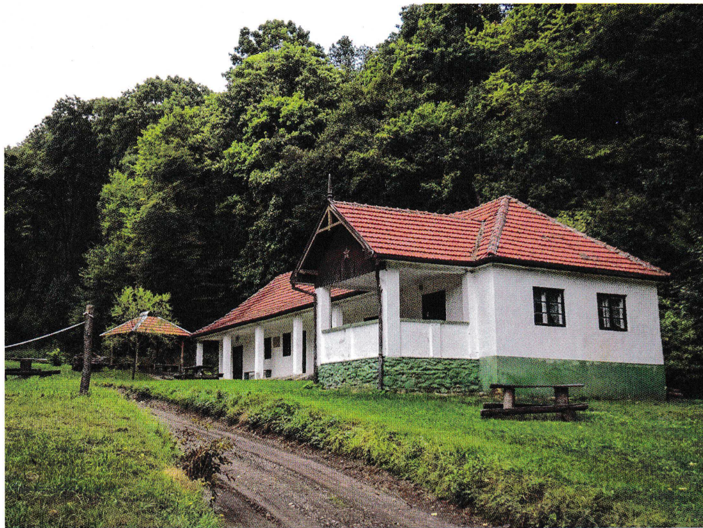
Idilli kulcsosház a rengetegben

amely ma panzióként és étteremként üzemel, de eredetileg Bethlen Istvánnak, Magyarország miniszterelnökének volt a rezidenciája. A fenyőerdőkkel ölelt és csendes Jávorkút a környék egyik leghangulatosabb szálláshelyének ad otthont, amely a bükki túránk 24. kilométerénél fekszik. A kék jelzés innen a Bükk-fennsík belseje felé vezet, és a Lendeczky út mentén fenyvesekkel, víznyelőkkel és zombolyokkal tagolt, zöldellő alpesi tájat tár elénk, míg végül a Lusta-völgy mély barázdájában el nem éri a Bükkszentkeresztre vezető országutat. A műút keresztezése után a Száraz-Szinván emelkedünk Bükkszentkeresztig, ahol a turisták számára minden földi jó megtalálható, még panorámás kilátó is, bár ehhez jelentős kitérőt kell tennünk az eredeti utunkról.